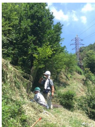
葉大尾根はカンカン照り