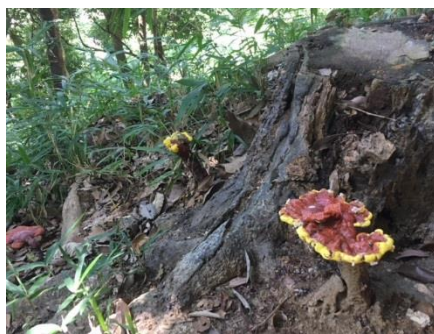
途中で見つけた毒キノコ?