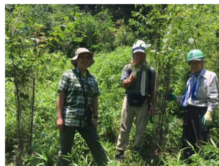
今日の作業はこれで完了!