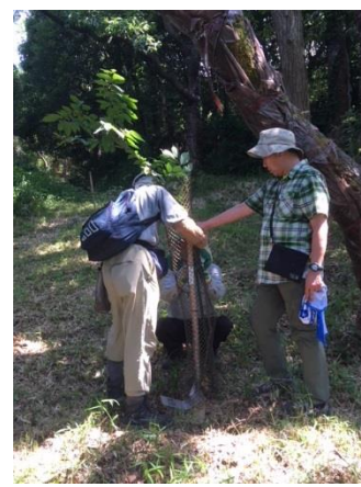
ウッドガード取付け作業