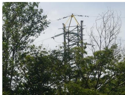
鉄塔付け替え工事