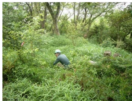
生い茂るネザサと格闘開始