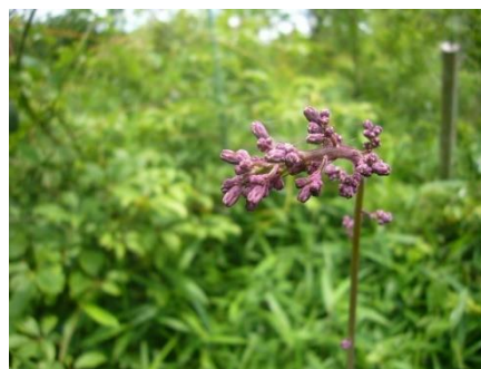
ムラサキニガナ (紫苦菜)