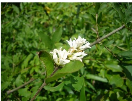
イボタノキ (水蠟の木)