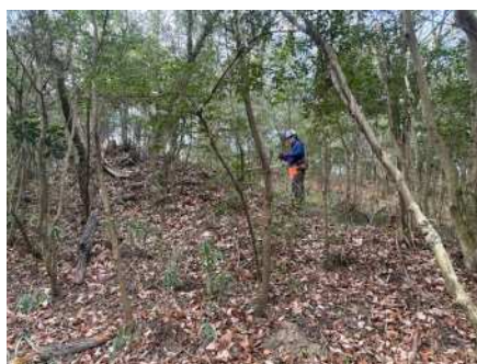
強風の中での作業