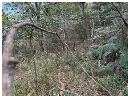
ツタがらみを撤去