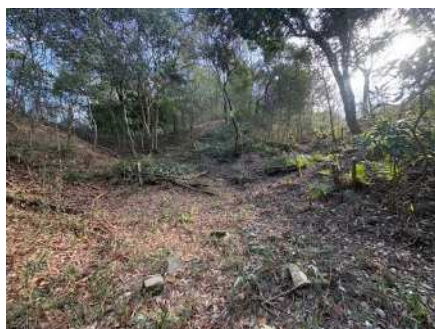
常緑低木の伐採後