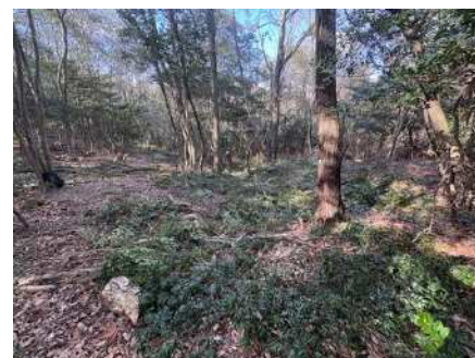
伐採後明るくなりました