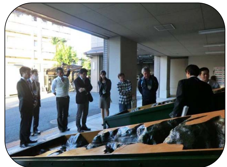
土石流の模型実験

本日の講習会の内容を踏まえ、安全に楽しく土砂災害に強い森づくりを進めていただきたいと思います。