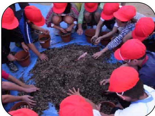
「横向き、横向き...」「土は八分目...」