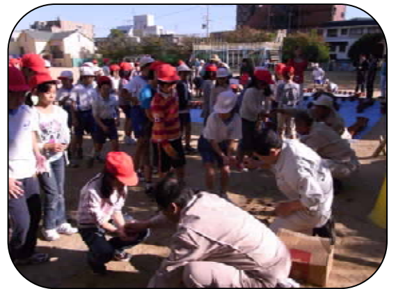
どんぐり育てるぞ！