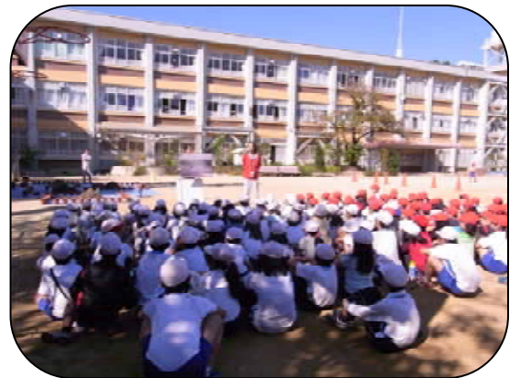
木が少ないと被害が大きいんだね

防災への関心が深まり、街を守る地域の一員として卒業までの2年間、どんぐりを立派に育てることをちかいました。