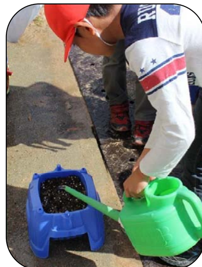
しっかり育ちますように