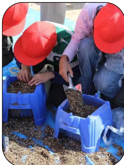
土はどれくらいかな？