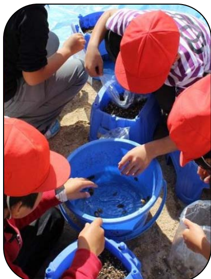
芽が出るどんぐりを調べます

自分たちのどんぐりが元気に大きくなって、山やまちを守ってくれるように、しっかり育ててくださいね。