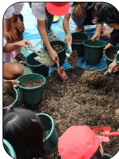
土はたっぷり入れます