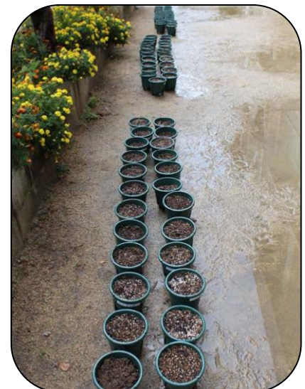
早く芽がでますように！