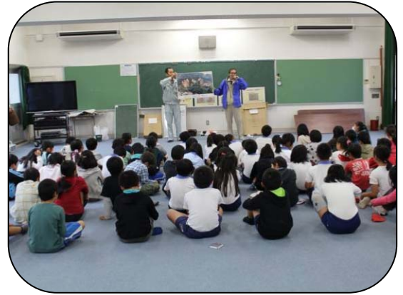
災害のお話を聞きます

雨が止み、校庭に出てどんぐりの鉢植えをしました。植える土がぬれて、まるでどろんこ遊びの気分で、楽しみながら植えることができました。みんなで、4 年生や 5 年生のお兄さん、お姉さんと同じように暑い夏も水をあげて、元気に育てるやくそくをしました。