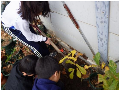
鉢からはみ出した根を掘りだします

神戸の市街地が見わたせる場所で植樹の説明を聞いた後、ペアを組んでいねいに植えていきました。重い木づちを使って、支柱をたたく作業や、あらなわをしっかりと結んでいく作業は少しむずかしそうですが、みんなとても楽しそうでした。「5 回たたいたらチェンジ！」などと声をかけ協力し合いながら作業を進めていき「大きく育ててね」と願いをこめて、水やりをして植樹を終えました。