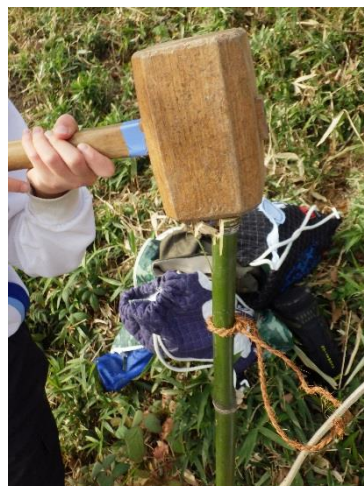
竹が割れちゃった