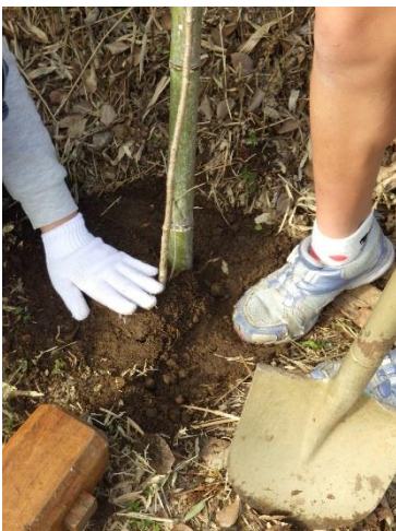
しっかりと踏み固めます