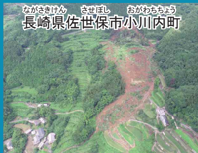
ながさきけん させぼし おがわちちよう 長崎県佐世保市小川内町