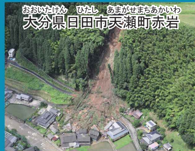
おおいたけん ひたし あまがせまちあかいわ 大分県回田市天瀬町赤岩