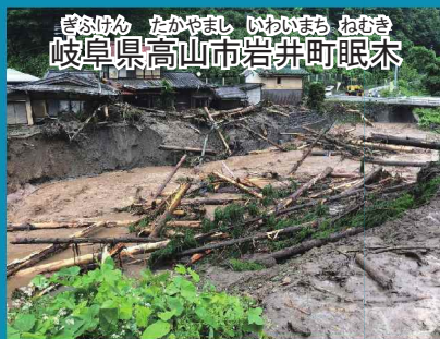
ぎふけん たかやまし いわいまち ねむき 岐阜県高山市岩井町眠末