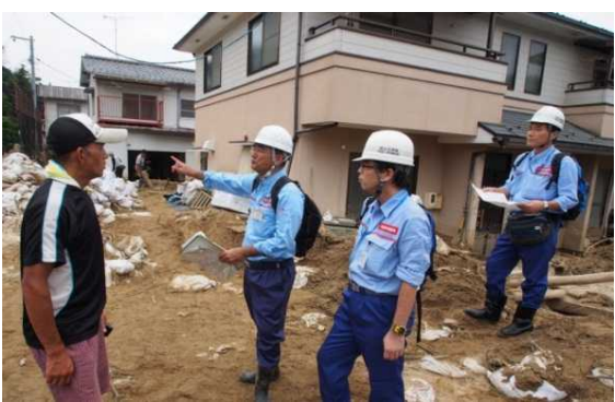
道路啓開箇所における地元住民との調整