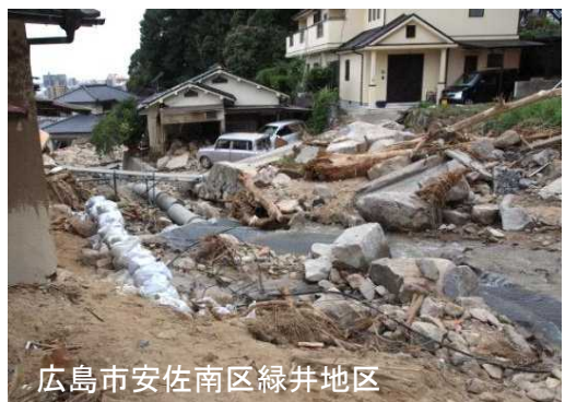
広島市安佐南区緑井地区