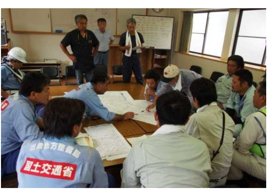
地元住民・地元建設業者との打合せ