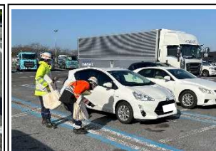
調査状況写真(南条サービスエリア)