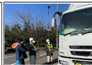
啓発状況写真(道の駅「みくに」)