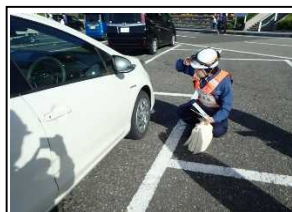
調査状況写真(道の駅「河野」)