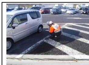
調査状況写真(南条サービスエリア)