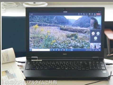
現場状況をリアルタイムで共有