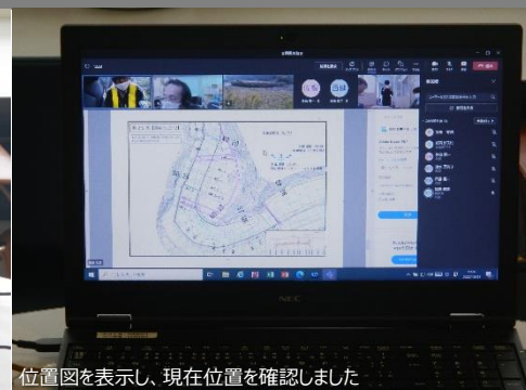
位置図を表示し、現在位置を確認しました