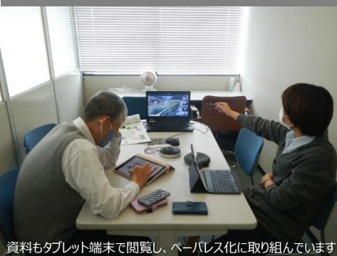
資料もタブレット端末で閲覧し、ペーパーレス化に取り組んでいます