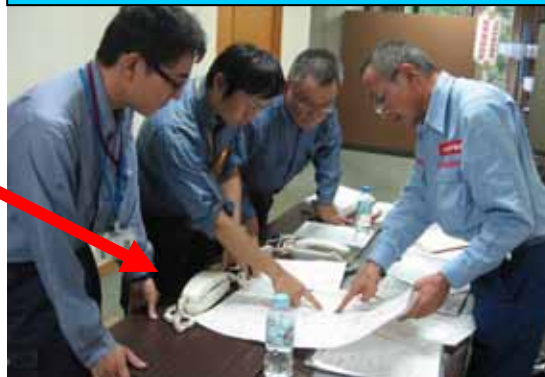
〔役場内での打合せ状況(十津川村)〕