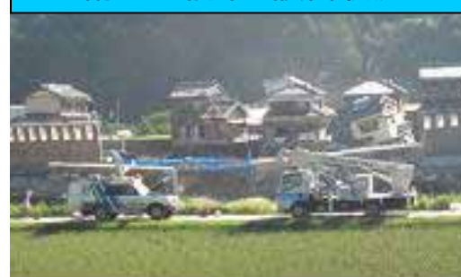
〔輪中堤の復旧工事状況を送信(高岡)〕