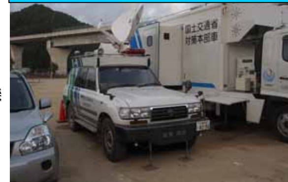
〔災害対策本部(那智勝浦町)〕

那智勝浦町の現地災害対策本部の運営を支援するため、通信機能を有する災害対策本部車を派遣