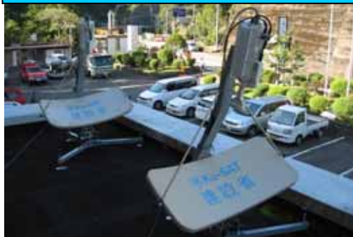
〔空中線設置状況(十津川村)〕