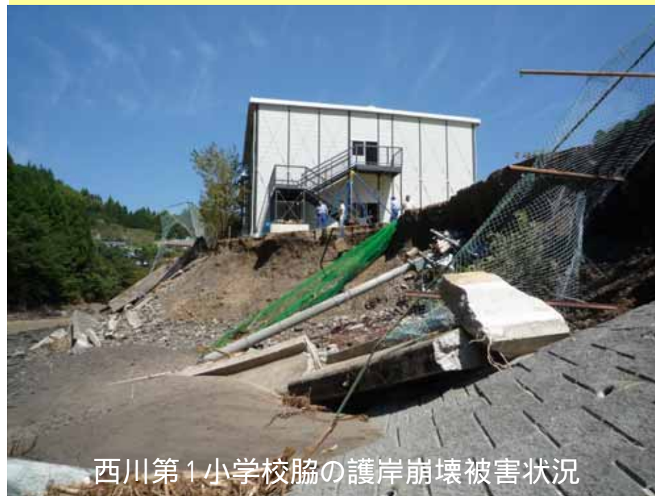
西川第1小学校脇の護岸崩壊被害状況