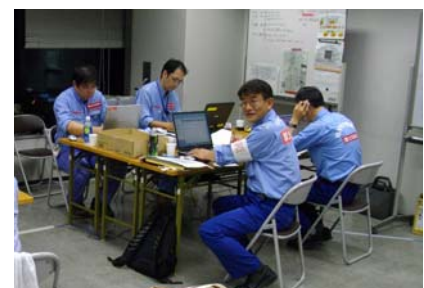
奈良 TEC-FORCE 司令部での活動状況