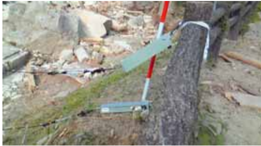
熊野ワイヤーセンサー