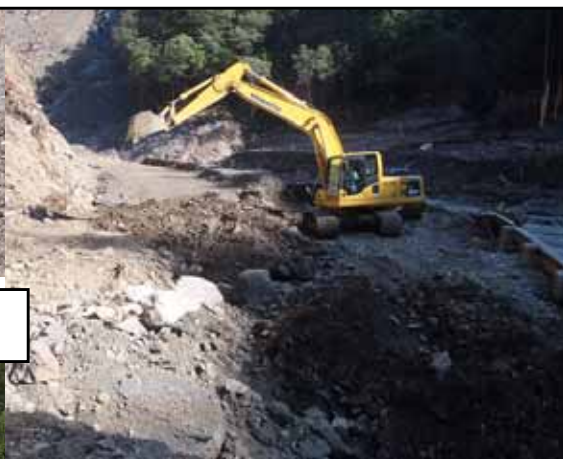
工事用道路整備作業(県道)