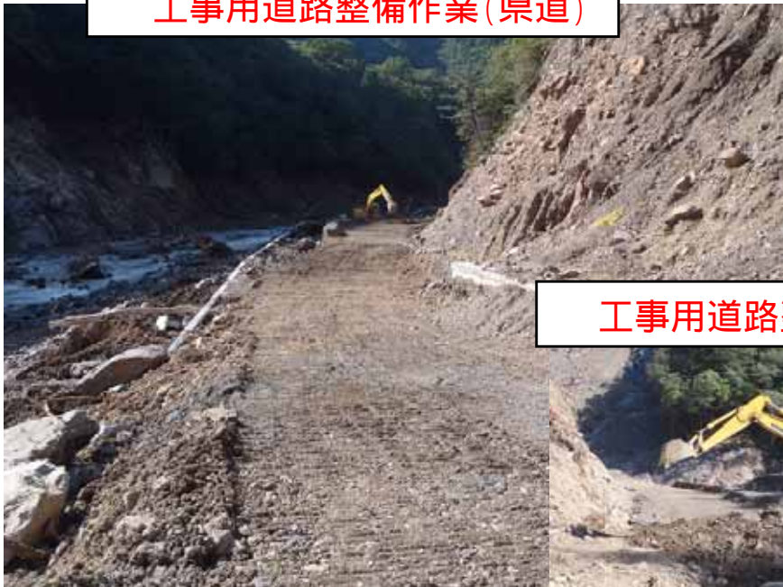
工事用道路整備作業(県道)