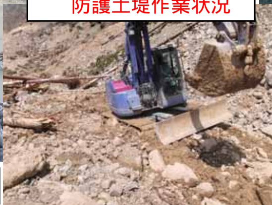
防護土堤作業状況