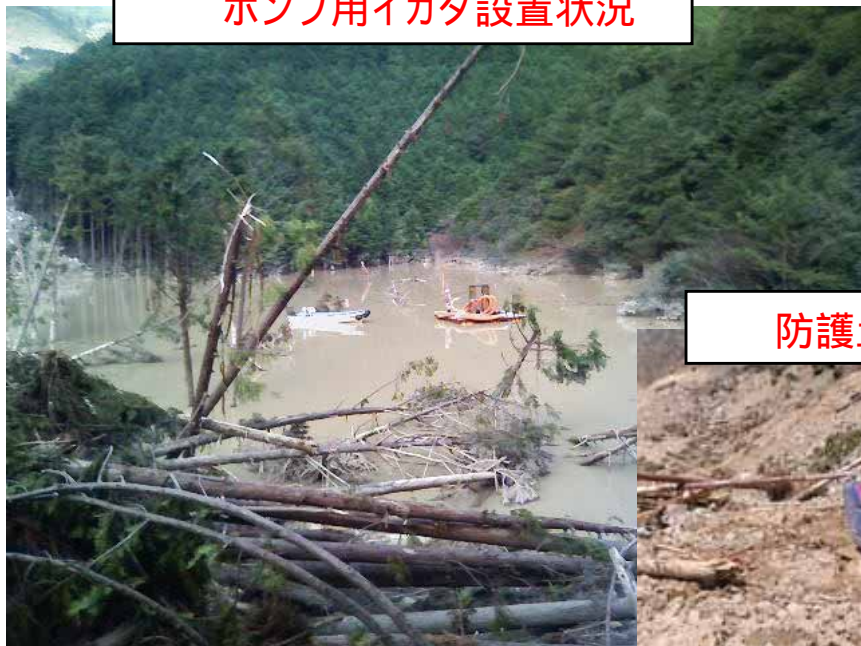
ポンプ用イカダ設置状況