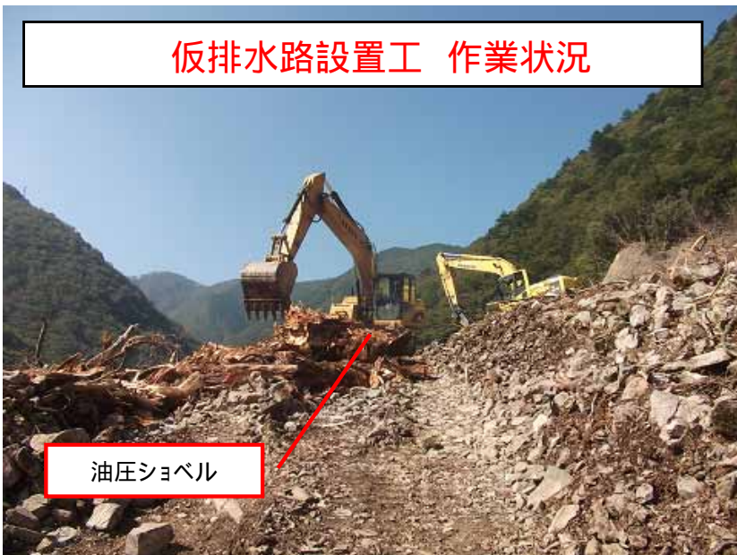
仮排水路設置工 作業状況