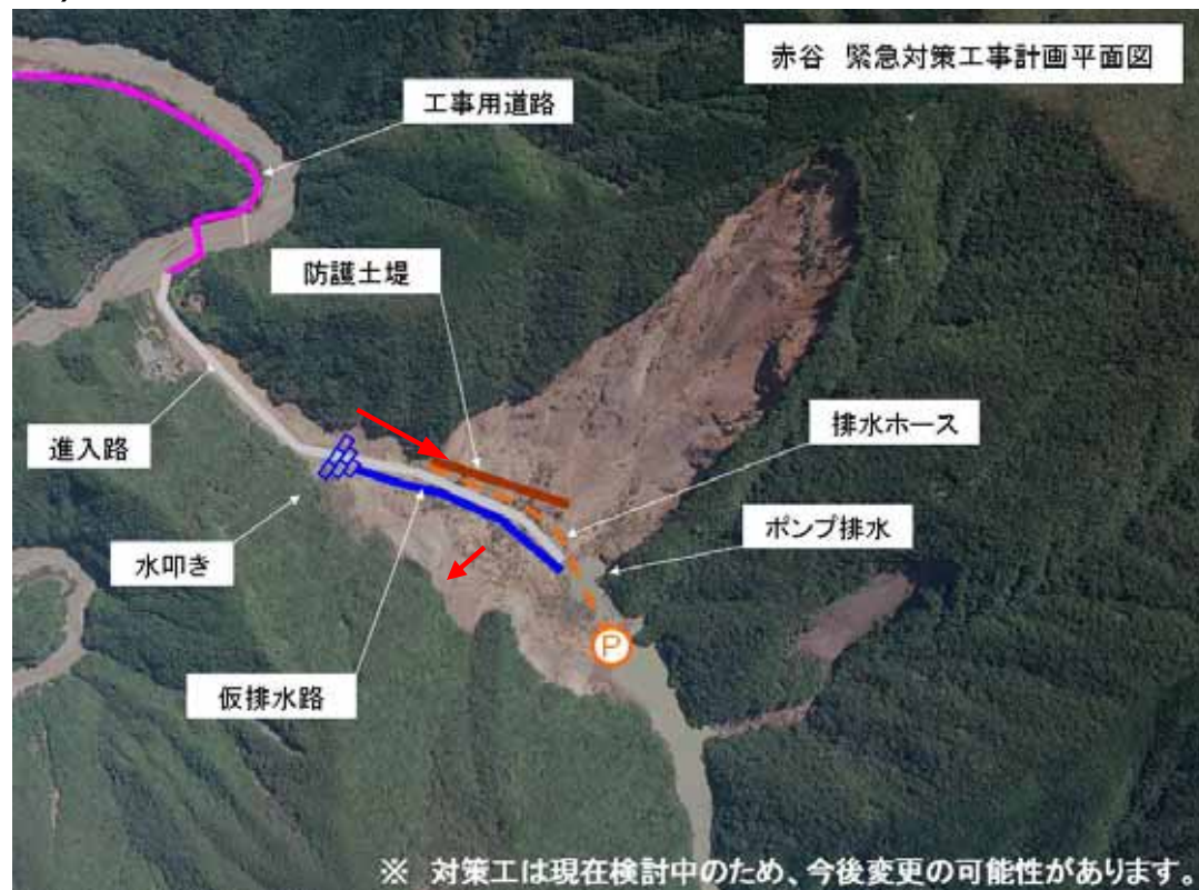
赤谷 緊急対策工事計画平面図