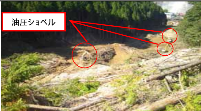
進入路倒木除去・切断・集積状況