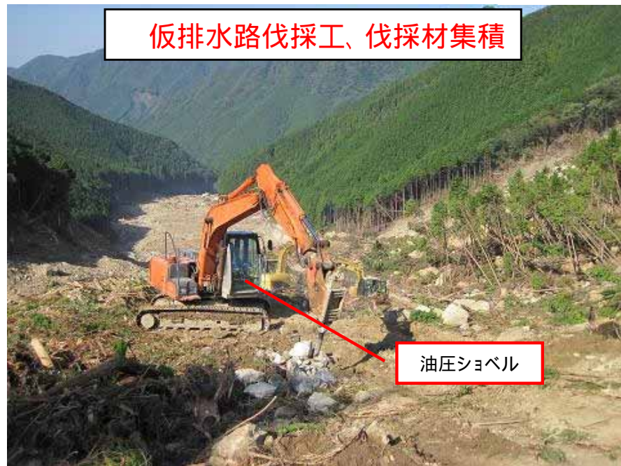
仮排水路伐採工、伐採材集積