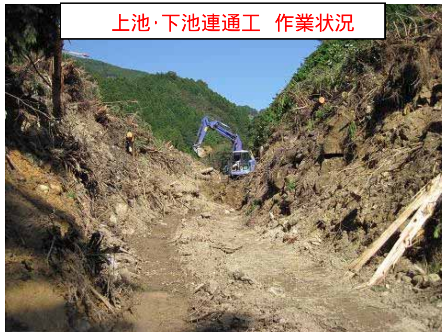
上池・下池連通工 作業状況