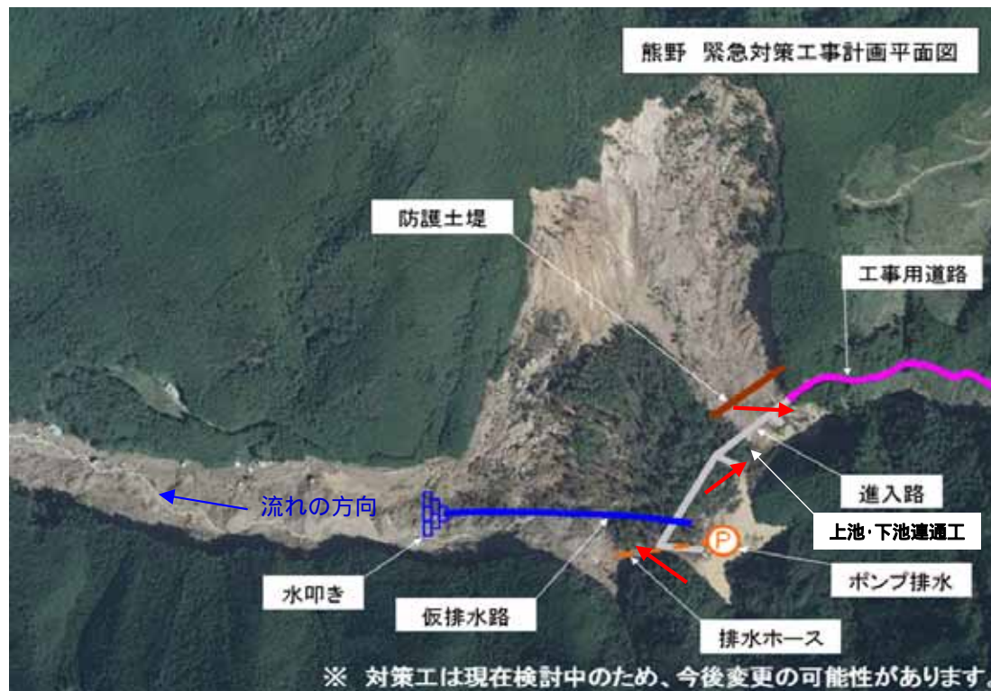
写真内 は左の写真番号を示し、矢印は撮影方向を示す。