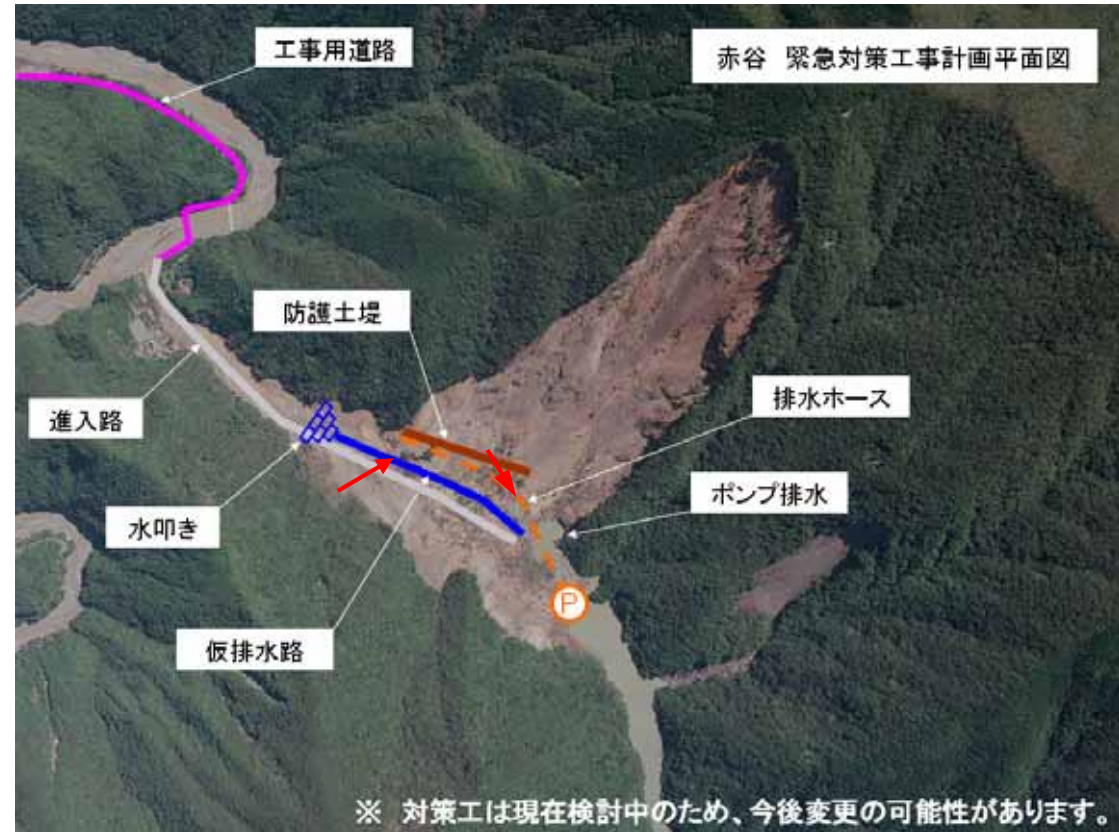
写真内 矢印は撮影方向を示す。