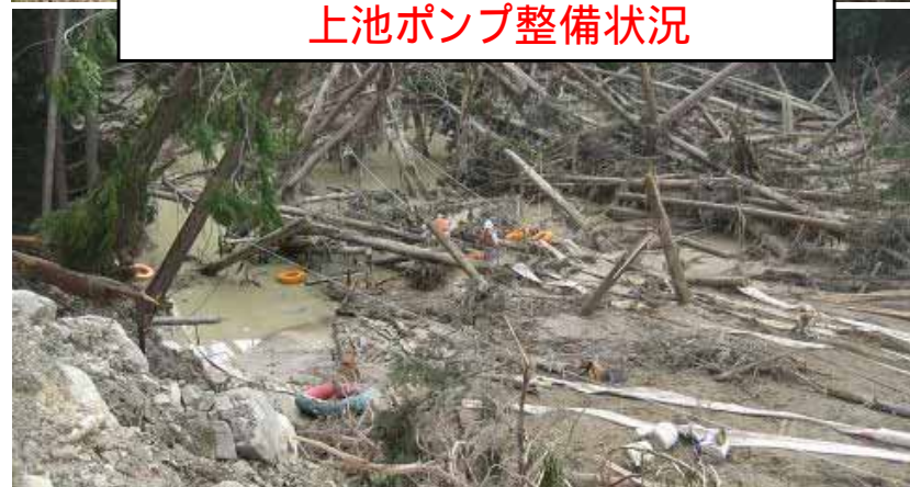
上池ポンプ整備状況