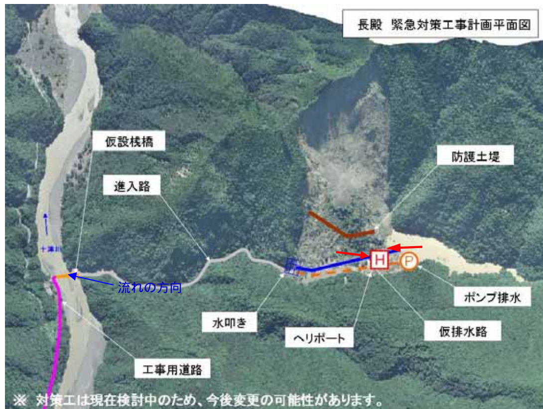
長殿 緊急対策工事計画平面図