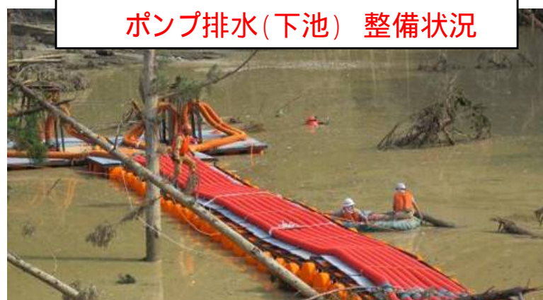
ポンプ排水(下池) 整備状況