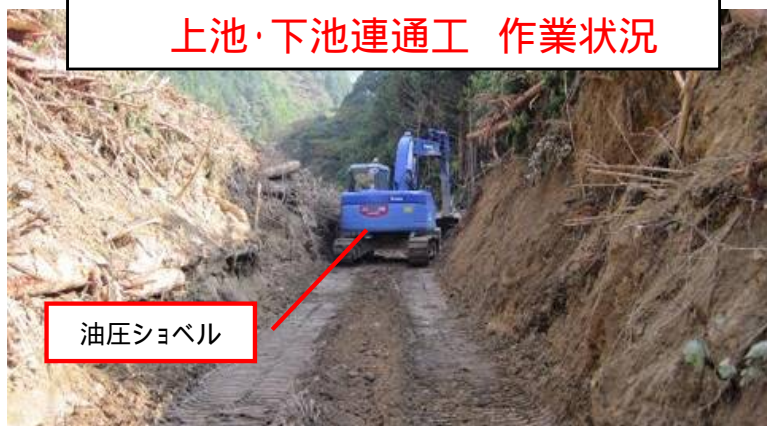
上池・下池連通工 作業状況