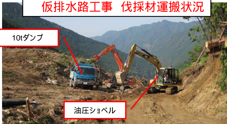
仮排水路工事 伐採材運搬状況