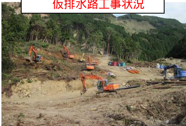
仮排水路工事状況