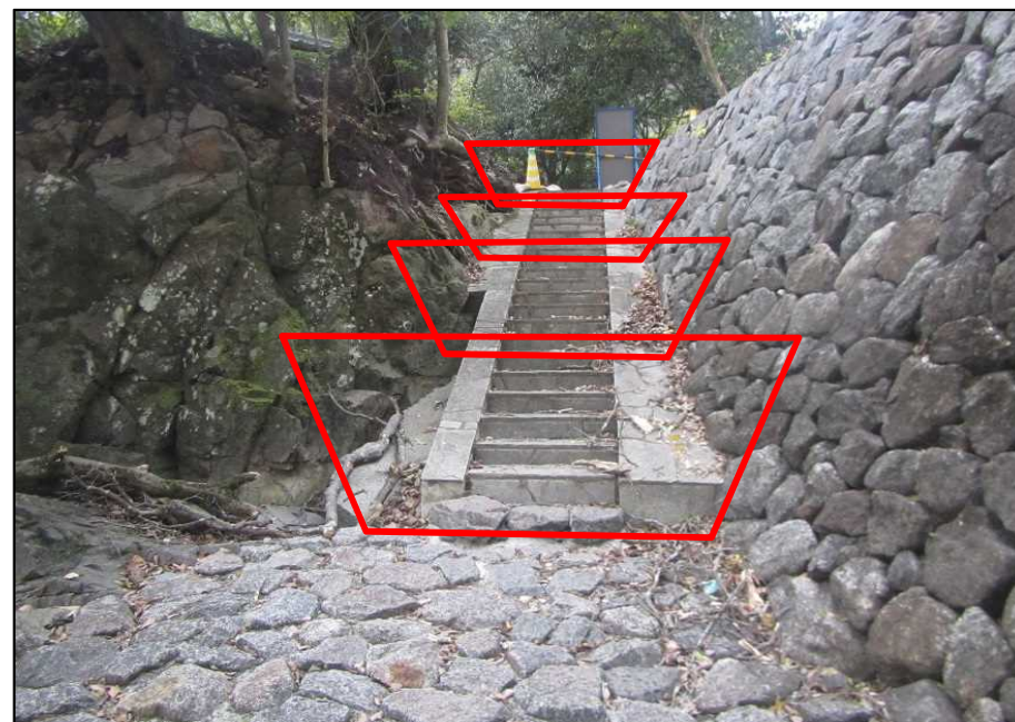
表面イメージ: 鉄平石仕上げ