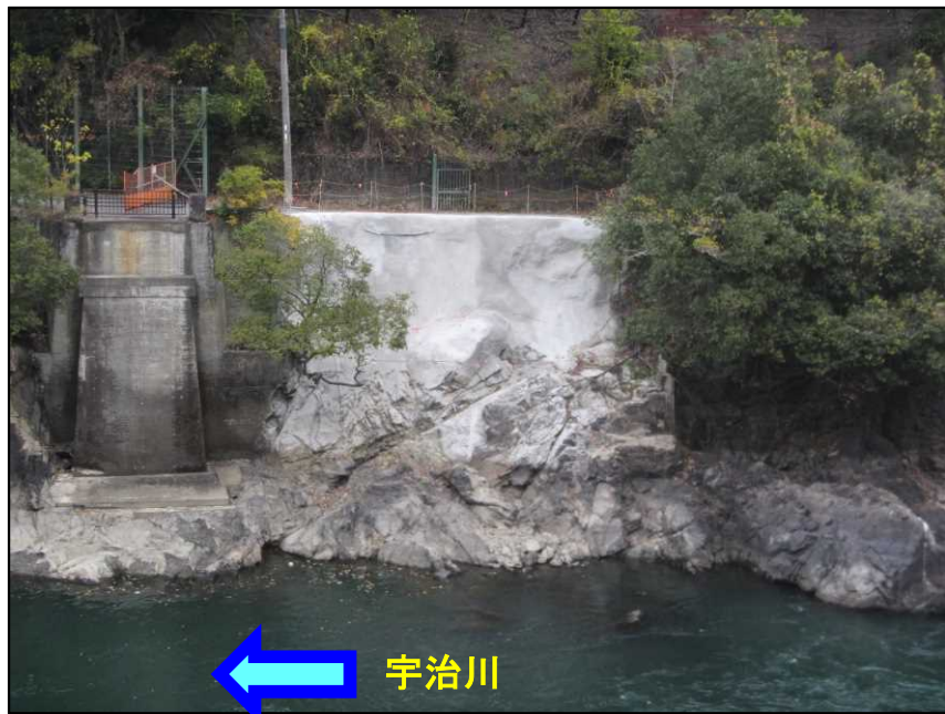
着手前(令和5年11月28日撮影)