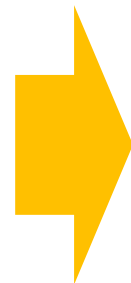
着手後(整備イメージ)