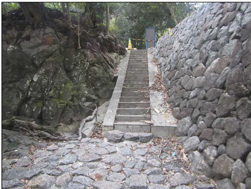
着手前(令和5年11月28日撮影)