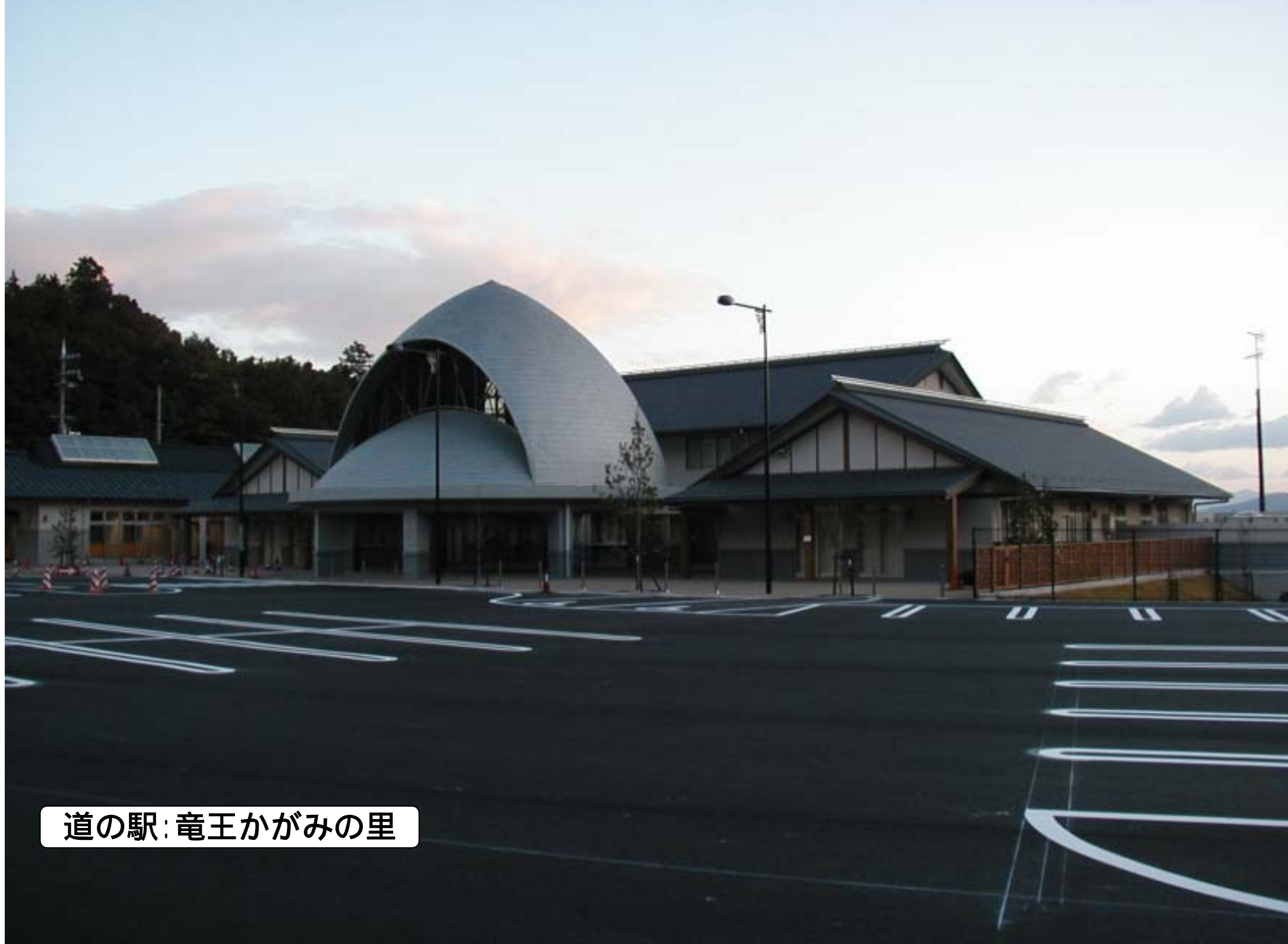
道の駅：竜王かがみの里