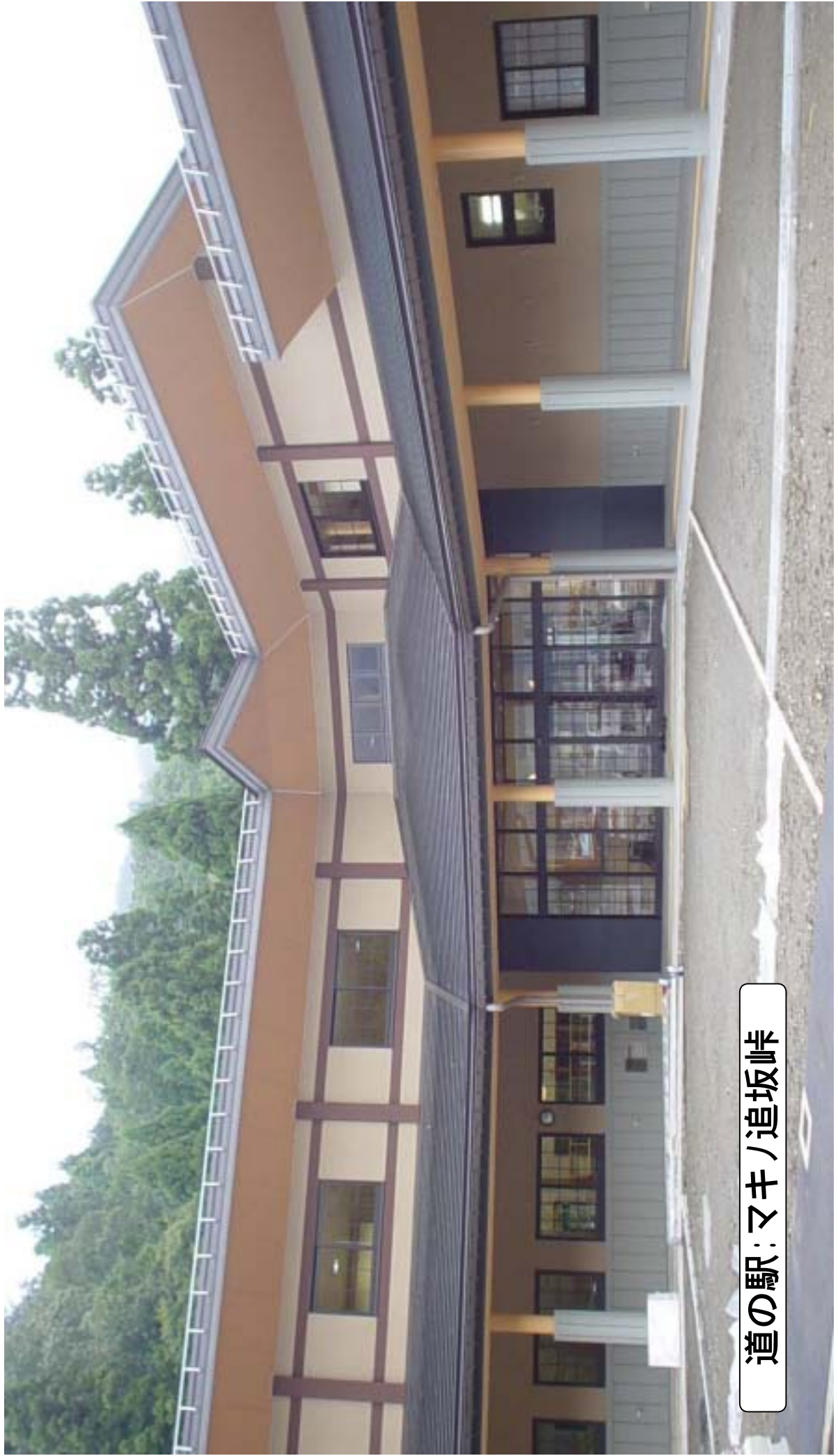
道の駅: マキノ追坂峠