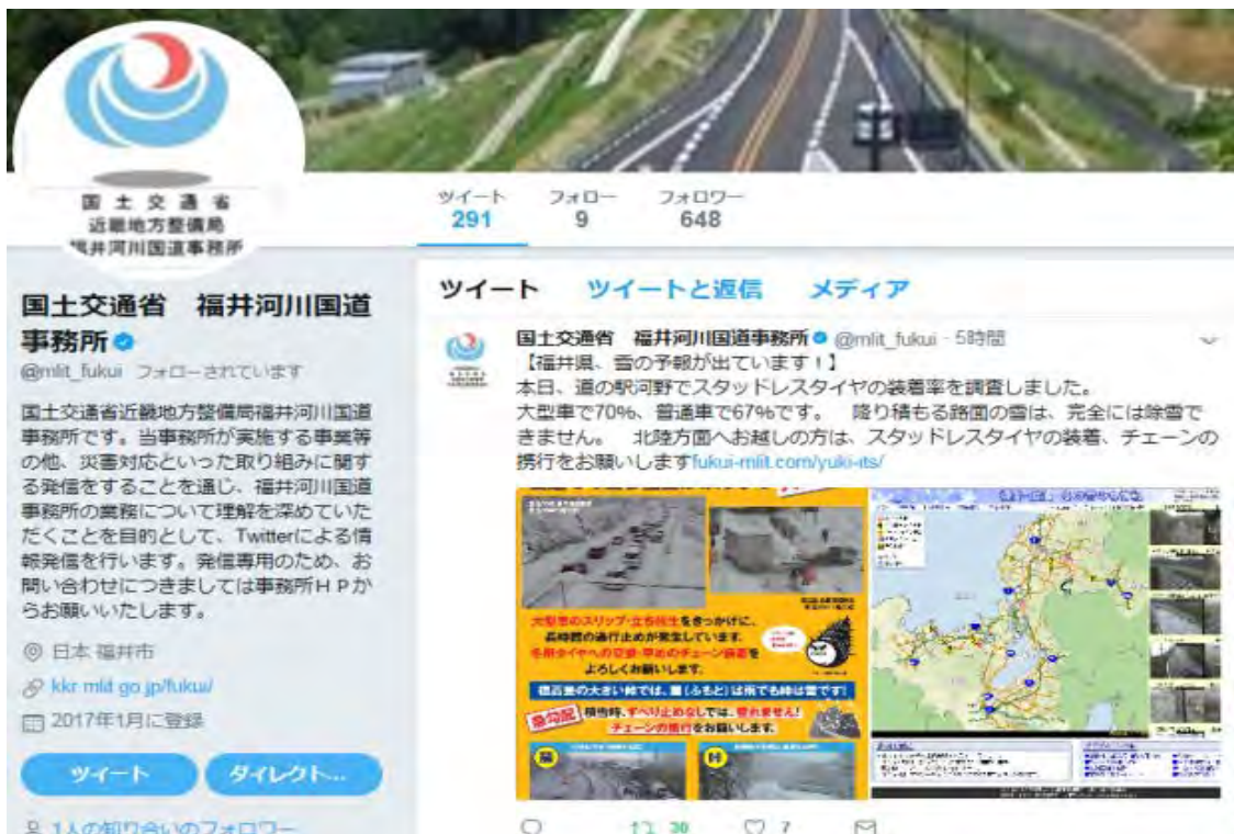
※福井河川国道事務所におけるツイート