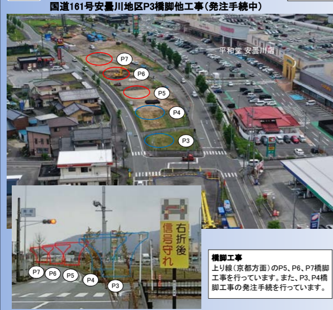
橋脚工事 上り線(京都方面)のP5、P6、P7橋脚工事を行っています。また、P3、P4橋脚工事の発注手続を行っています。