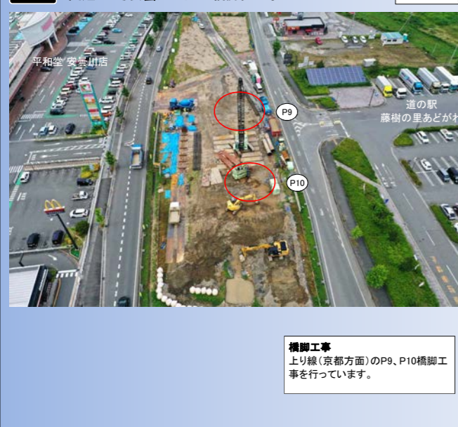
橋脚工事 上り線(京都方面)のP9、P10橋脚工事を行っています。