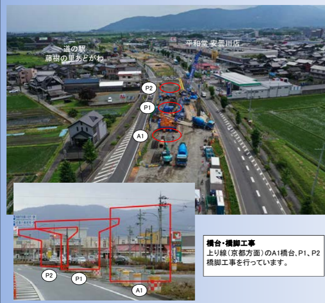
橋台・橋脚工事 上り線(京都方面)のA1橋台、P1、P2橋脚工事を行っています。