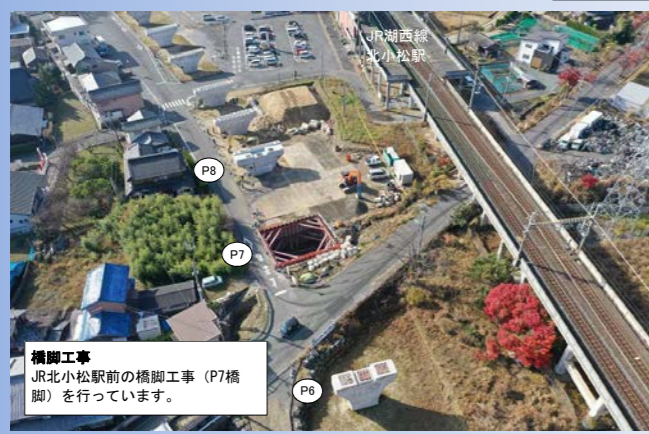
橋脚工事 JR北小松駅前の橋脚工事 (P7橋脚) を行っています。