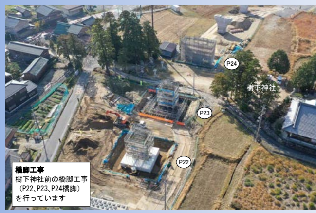
橋脚工事 樹下神社前の橋脚工事 (P22, P23, P24橋脚) を行っています