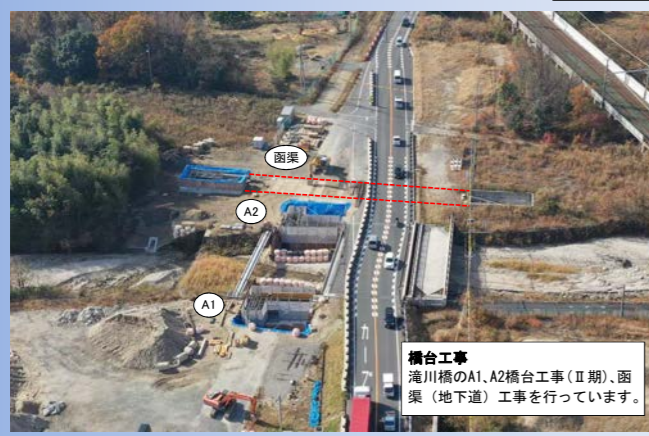
橋台工事 滝川橋のA1, A2橋台工事 (II期)、函渠 (地下道) 工事を行っています。