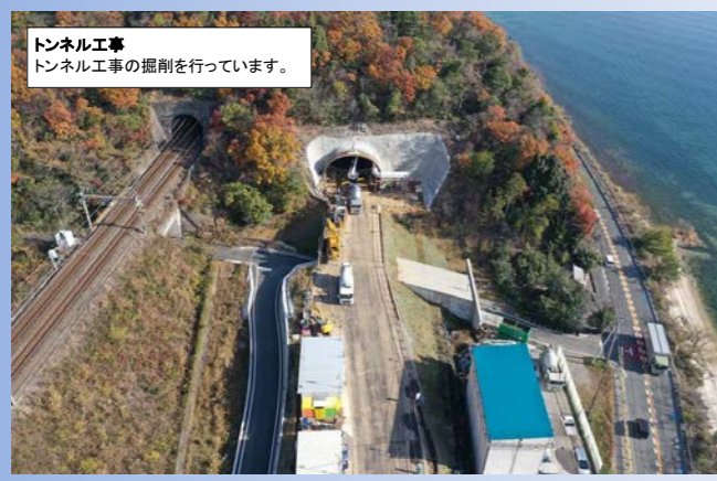
トンネル工事 トンネル工事の掘削を行っています。