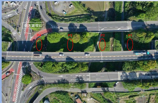
橋脚工事 湖西道路4車線化に向けた、下り線(京都方面)の橋脚工事を行っています。