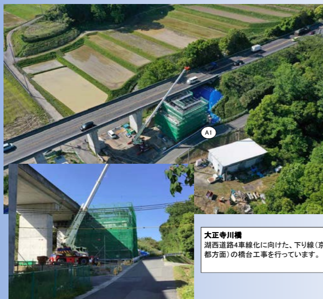
大正寺川橋 湖西道路4車線化に向けた、下り線(京都方面)の橋台工事を行っています。