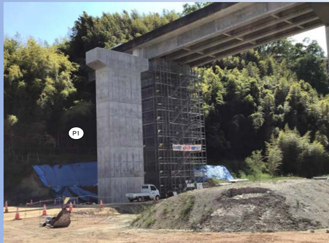
天神川橋 湖西道路4車線化に向けた、下り線(京都方面)の橋脚工事、上り線(福井方面)の耐震補強工事を行っています。