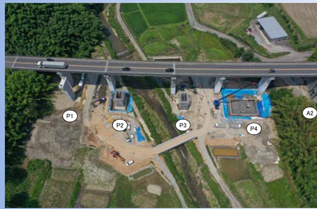
天神川橋 湖西道路4車線化に向けた、下り線(京都方面)のP2、P3、P4橋脚工事、A2橋台改築工事を行っています。