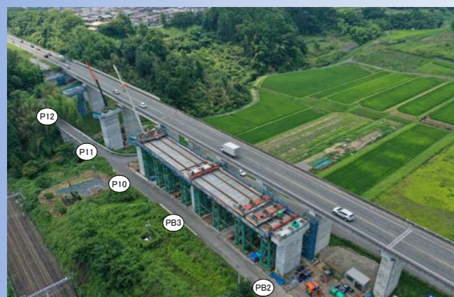
大正寺川橋 湖西道路4車線化に向けた、下り線(京都方面)の下部工が完成し、上部工の設置工事を行っています。