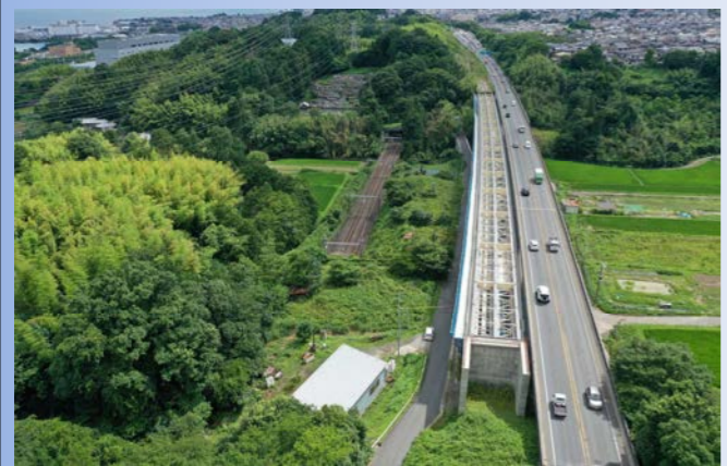
TOPICS 3 湖西道路大正寺川橋床版工事 R3.7月撮影

大正寺川橋 湖西道路4車線化に向けた、下り線(京都方面)の下部工が完成し、上部工の架設が完了し、床版工事を行っています。