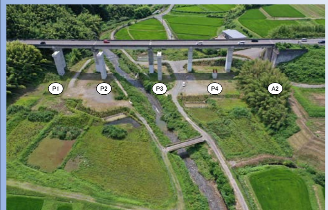
TOPICS 1 湖西道路天神川橋 R3.7月撮影

天神川橋 湖西道路4車線化に向けた、下り線(京都方面)の橋脚工事(P1,P2,P3橋脚)が完了しました。途中完工している、P4橋脚、A2橋台改築工事は、今後の工事で行います。