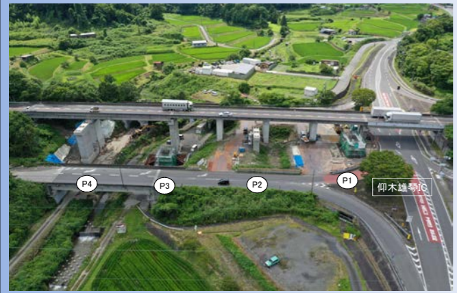
TOPICS 2 湖西道路雄琴川橋P1橋脚他工事 R3.7月撮影

雄琴川橋 湖西道路4車線化に向けた、下り線(京都方面)の橋脚工事(P1,P2,P3,P4橋脚)を行っています。