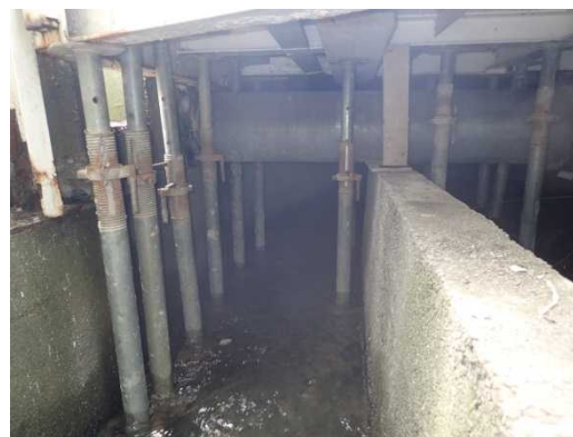
パイプサポートによる応急補強状況