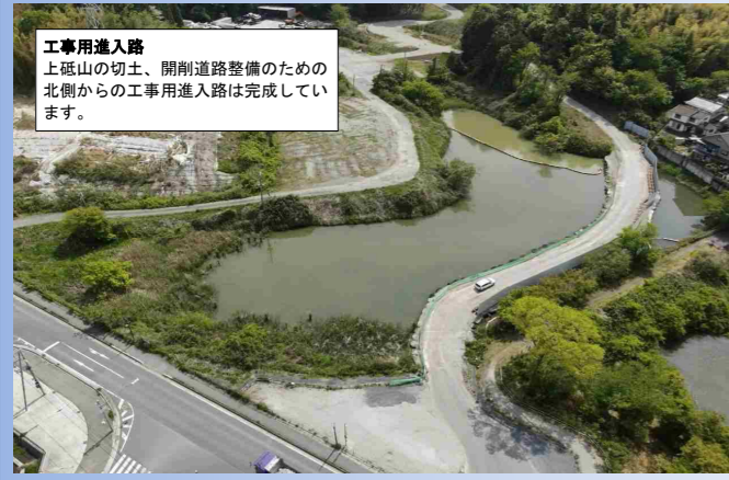
TOPICS 2 栗東水口道路上砥山切土(3期)工事

工事用進入路 上砥山の切土、開削道路整備のための北側からの工事用進入路は完成しています。