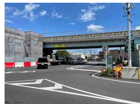
【通行規制②】 高さ4.1m ※高架下のみ