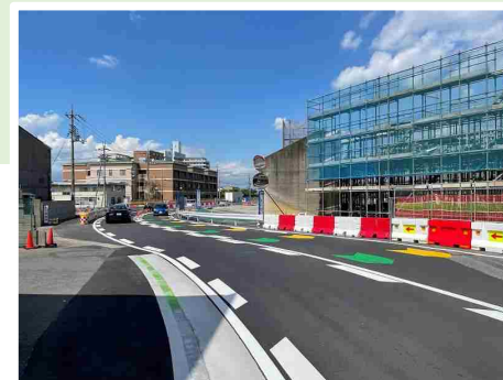
【通行規制①】 幅2.5m・長さ12.0m