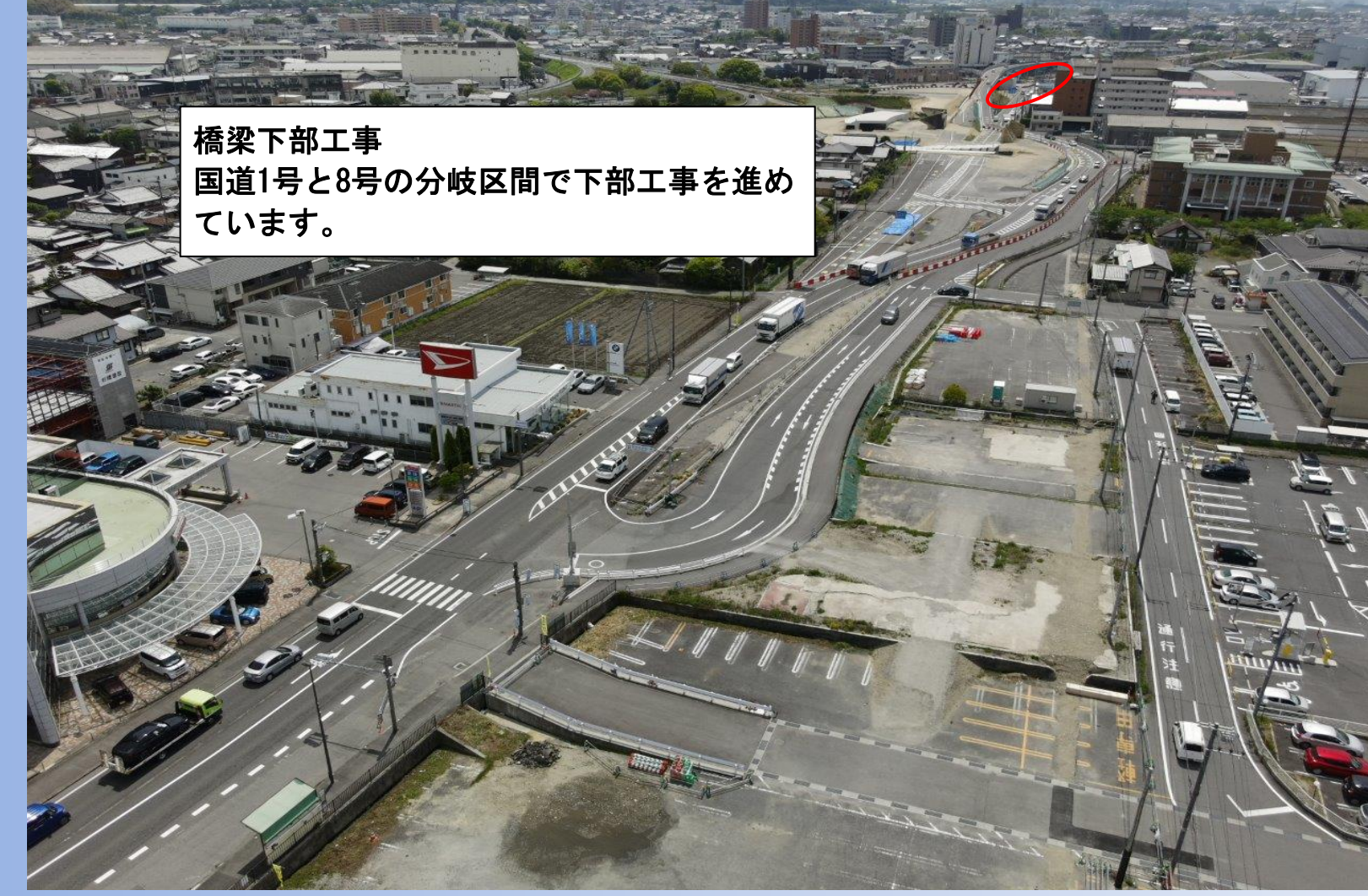
橋梁下部工事 国道1号と8号の分岐区間で下部工事を進めています。