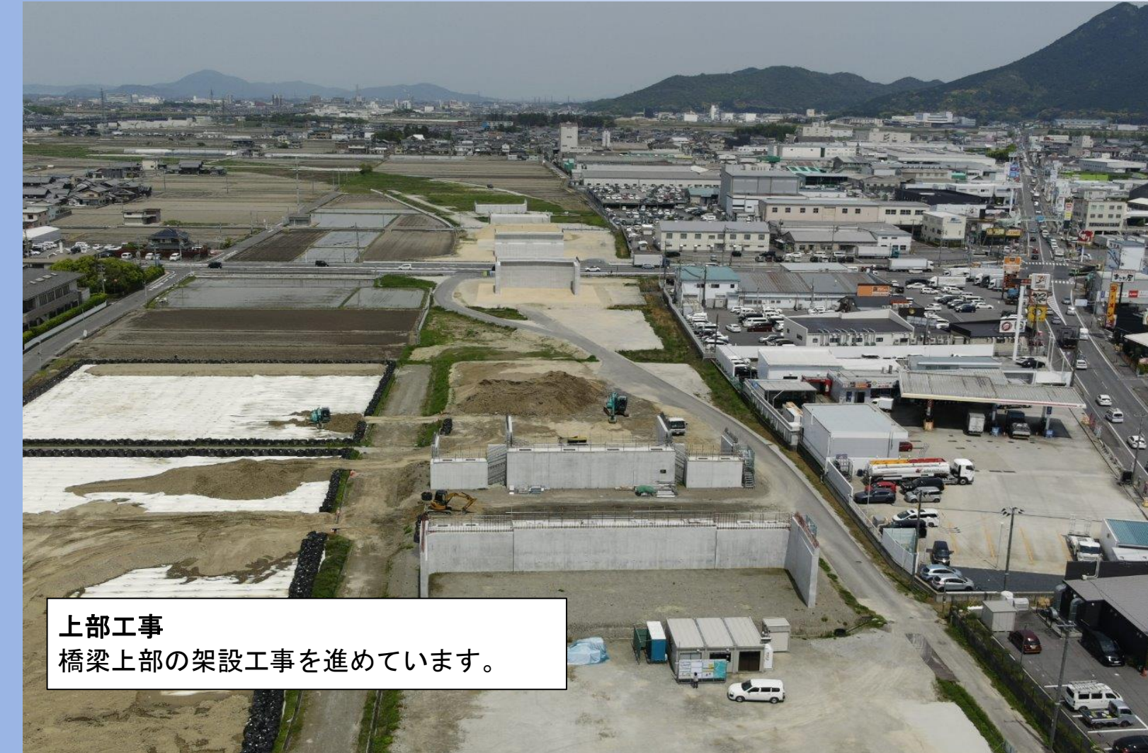
上部工事 橋梁上部の架設工事を進めています。