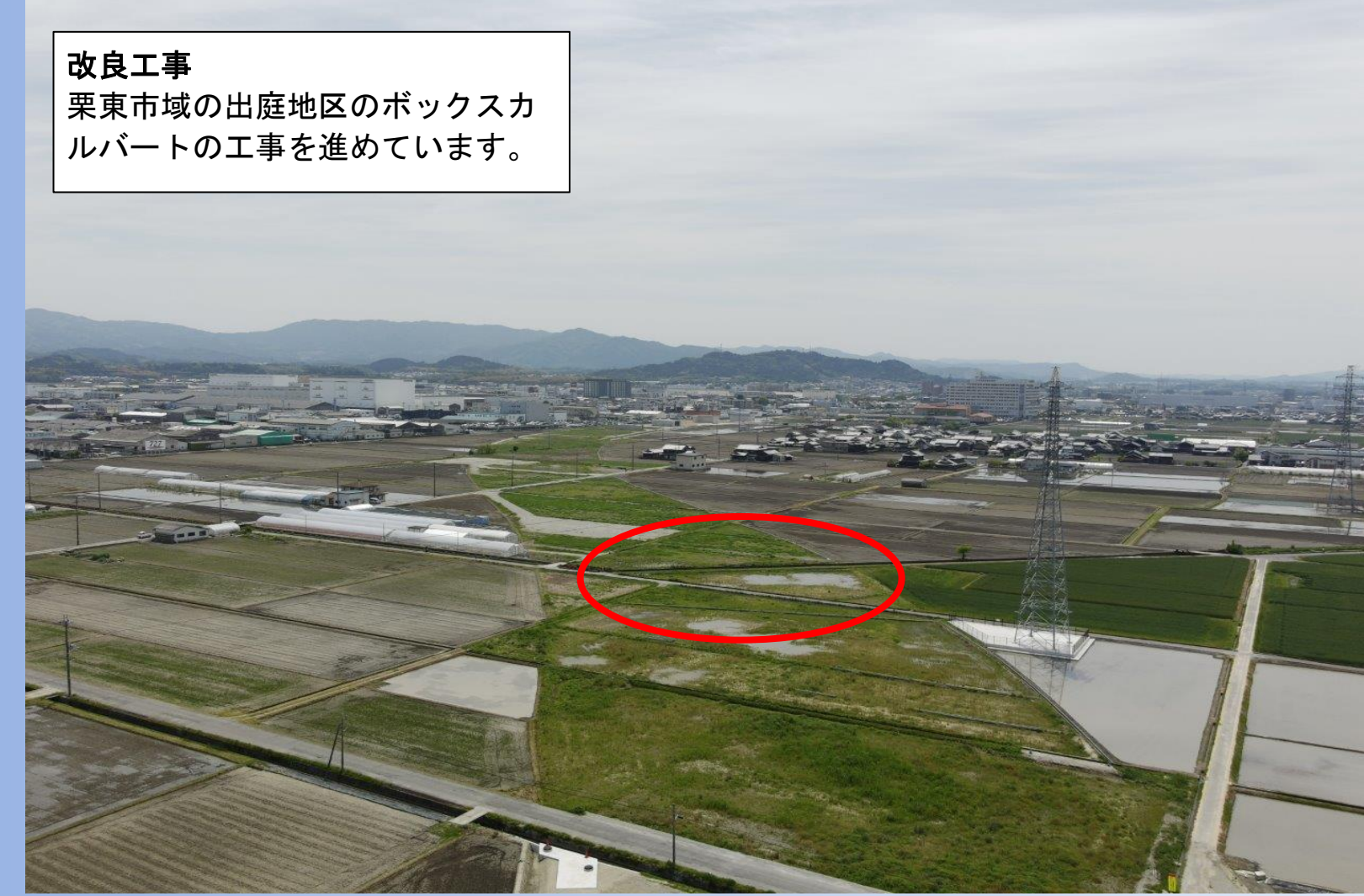
改良工事 栗東市域の出庭地区のボックスカルバートの工事を進めています。