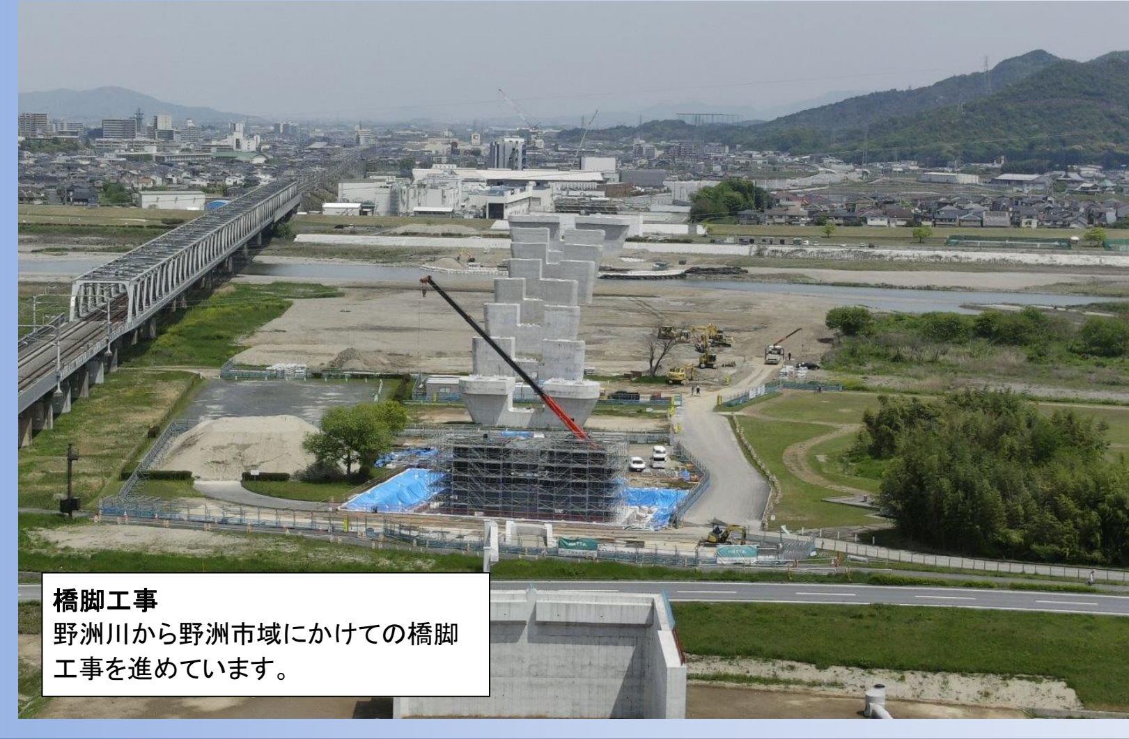
橋脚工事 野洲川から野洲市域にかけての橋脚工事を進めています。

TOPICS 2 野洲栗東バイパス出庭地区函渠他設置工事 野洲栗東バイパス出庭地区函渠他設置工事