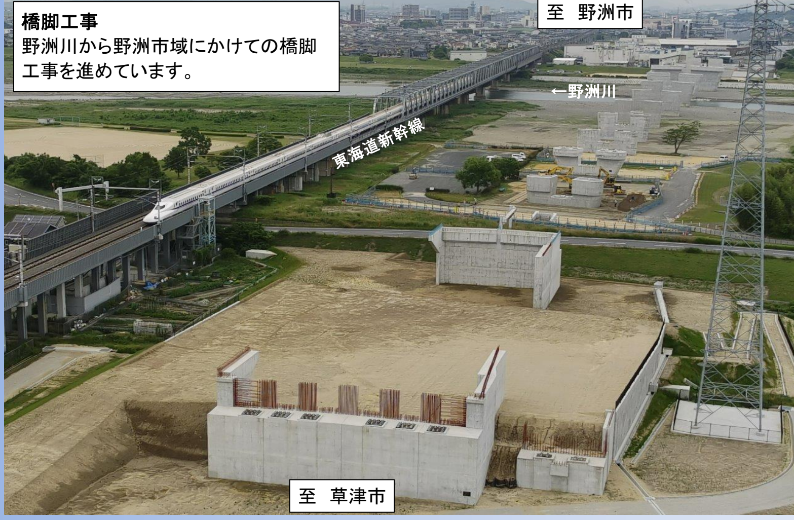
橋脚工事 野洲川から野洲市域にかけての橋脚工事を進めています。

TOPICS 1 野洲栗東バイパス七間場高架橋P32橋脚他工事 野洲川橋P1橋脚他工事、野洲川橋P10橋脚他工事 R5.5月撮影