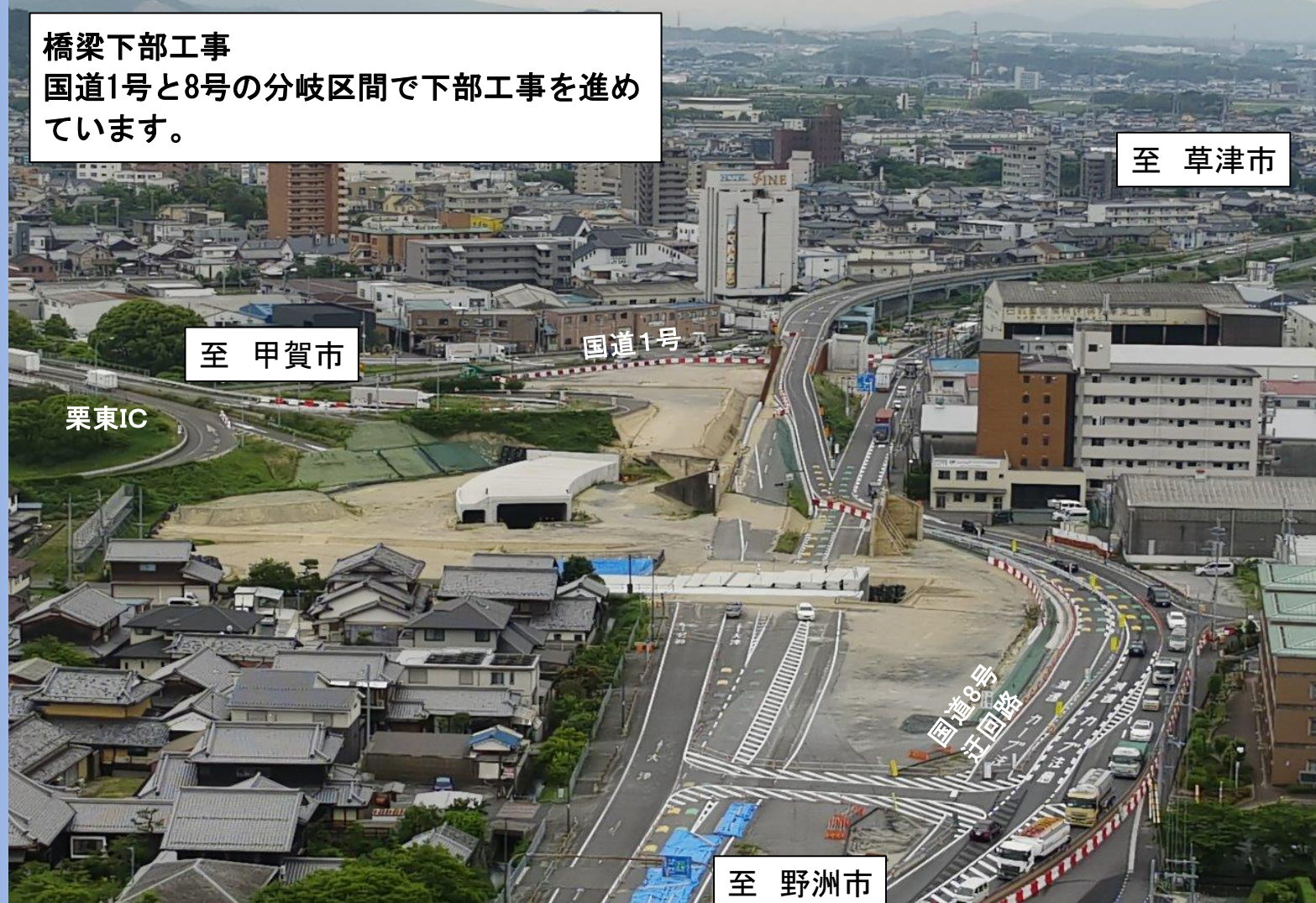
橋梁下部工事 国道1号と8号の分岐区間で下部工事を進めています。