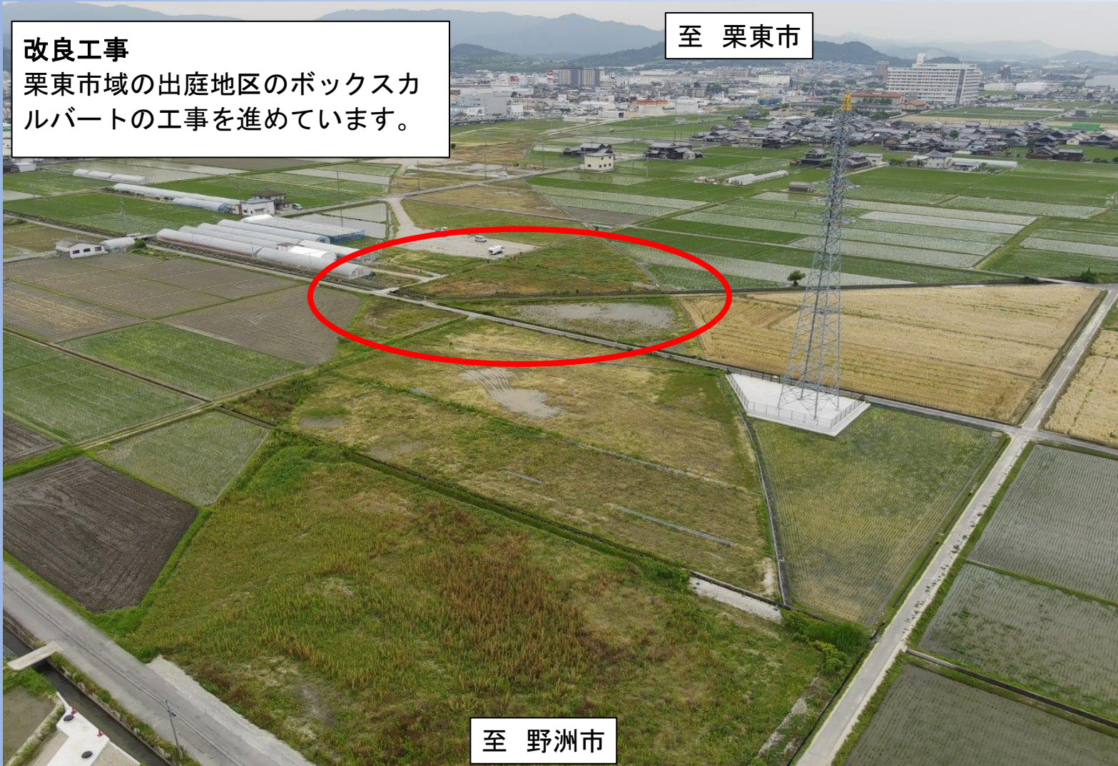
改良工事 栗東市域の出庭地区のボックスカルバートの工事を進めています。

TOPICS 2 野洲栗東バイパス出庭地区函渠他設置工事 野洲栗東バイパス出庭地区函渠他設置工事 R5.5月撮影