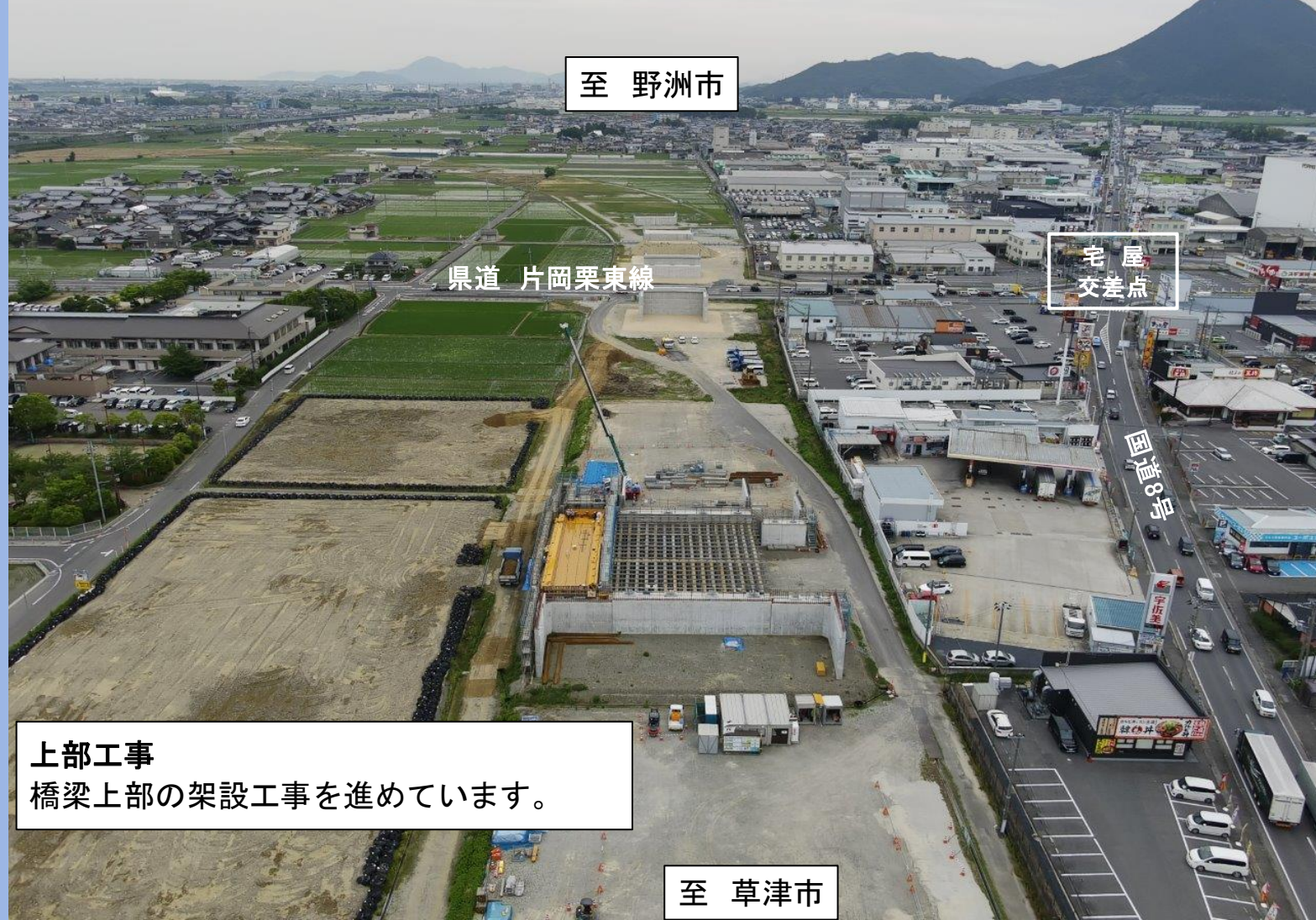
上部工事 橋梁上部の架設工事を進めています。