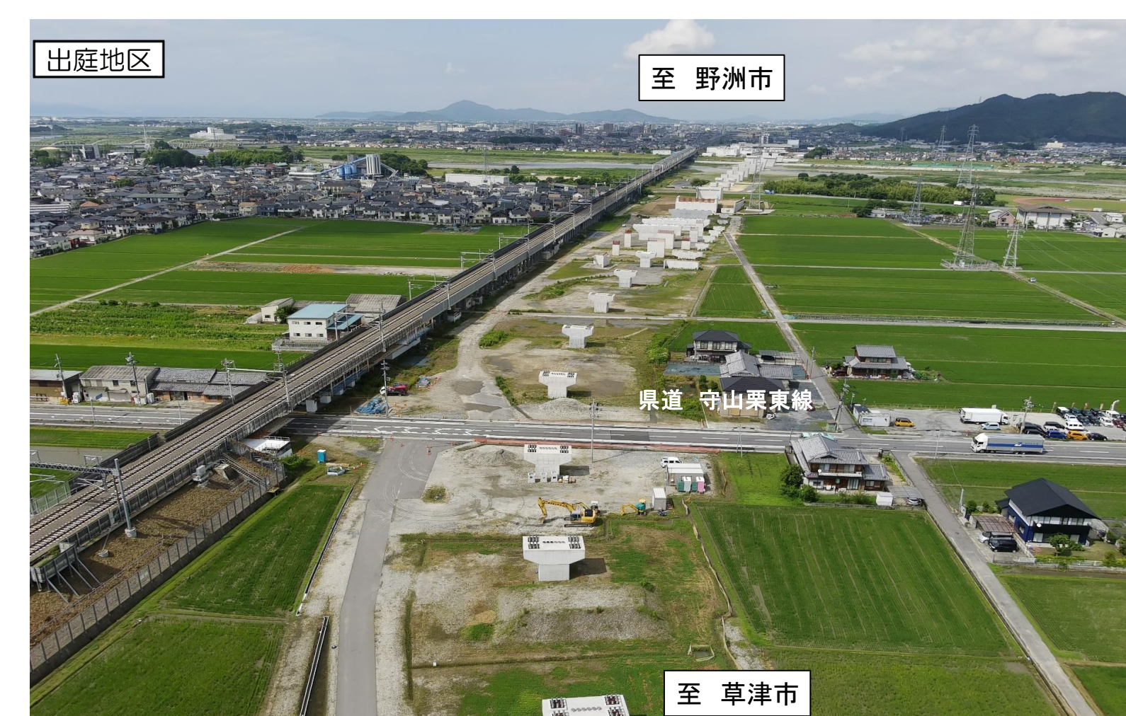
出庭地区 至 野洲市