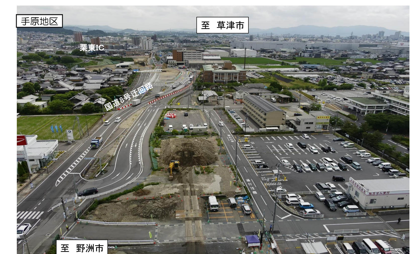
手原地区 至 草津市