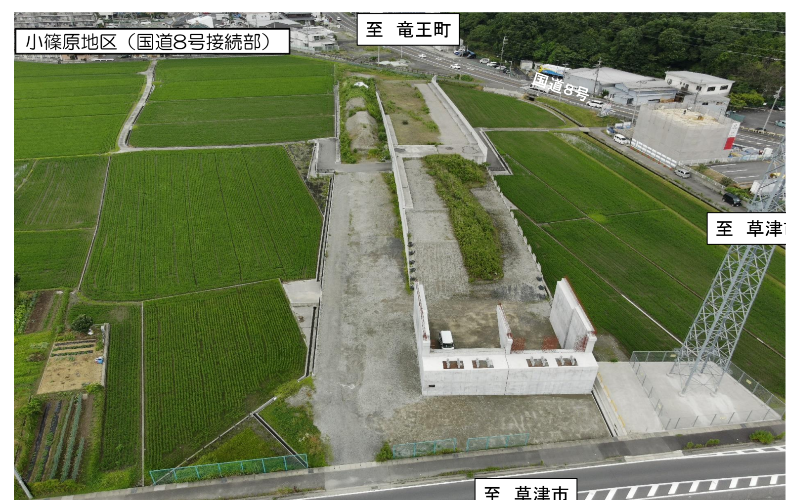
小篠原地区 (国道8号接続部) 至 竜王町