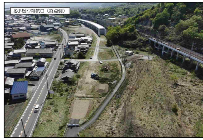
北小松トンネル坑口(終点側)