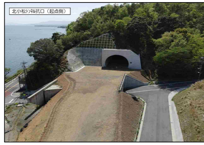
北小松トンネル坑口(起点側)