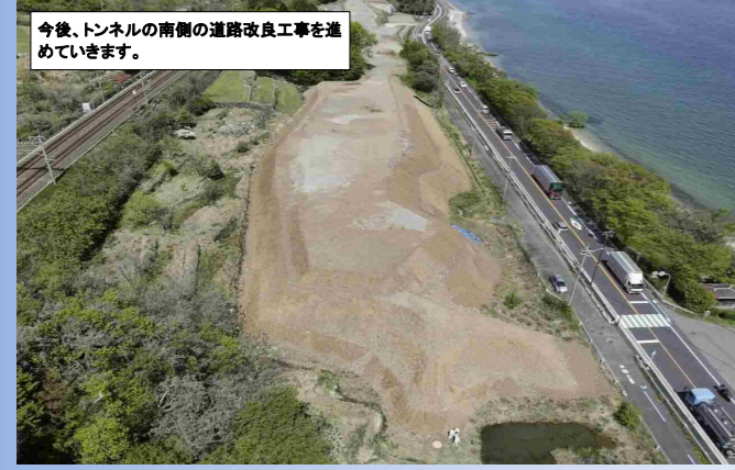
今後、トンネルの南側の道路改良工事を進めていきます。