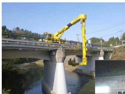
道路橋の点検状況