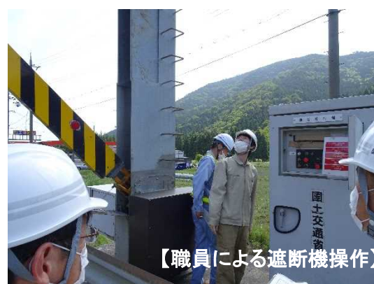
【職員による遮断機操作】