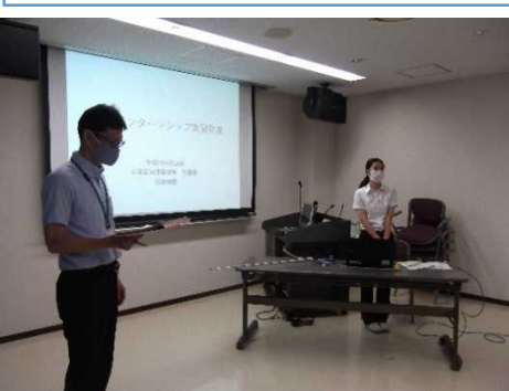
最終日には発表を行いました