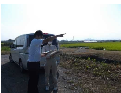
調査路線の現地踏査です