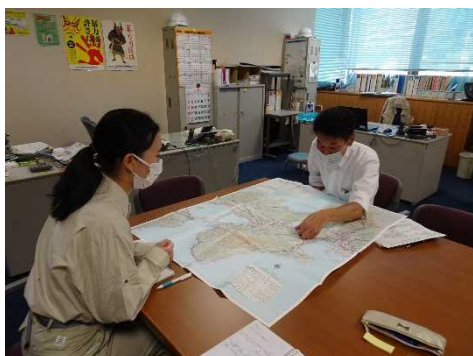
事業概要の説明を受けています