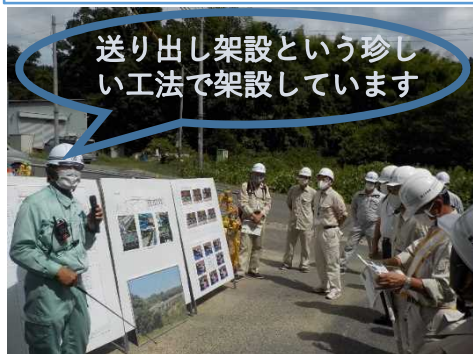
現在工事を行っている、大正寺川橋上部工事の見学会に参加しました