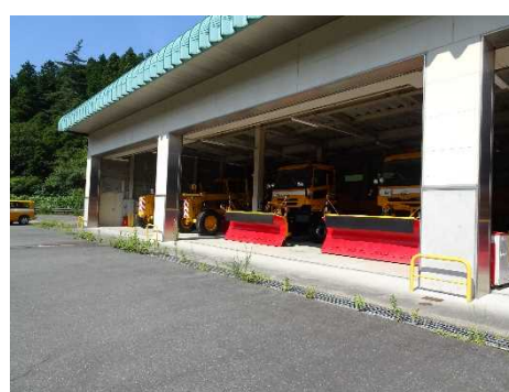
雪寒基地の見学です