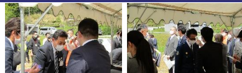
▲受付での検温の様子

ますます高齢化する地域の公共交通を確保するため、本サービスについては、地域のご意見や運行時期の特性等踏まえながら、運行計画等随時見直しつつ、よりよいサービスを目指してまいります。