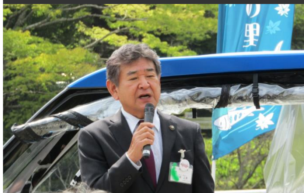
東近江市小椋市長ご挨拶