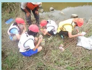
お菓子や食パン、自分で選んだ餌を もんどりに入れて設置したよ！