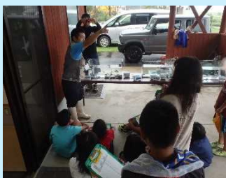
たくさんの魚が取れました。 エビや亀もいたよ！！