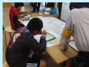
班ごとに魚類調査結果の発表！ 予想は当たっていたかな～？