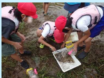
定置網とペットボトルもんどりには さまざまな生き物が入っていました。

前日に仕掛けた定置網とペットボトルもんどりをあげて、実際に魚・エビを観察しました。採れた魚が予想とあっているか確認し、加陽湿地にどんな魚がいるかを発表しました。