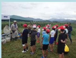
はじめに昆虫採集の方法と注意事項を聞きました！

虫取り網を片手に昆虫採集を行った後、班ごとに分かれ3カ所に定置網ともんどりを設置。昆虫を手で触るのは初めてで怖いけど、たくさん捕まいたいし頑張りました！！