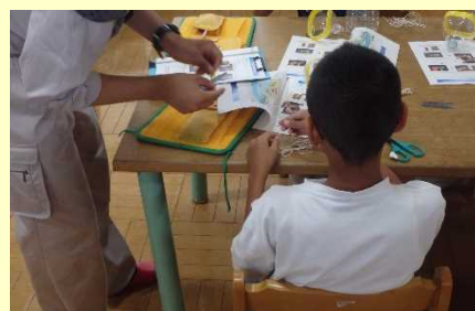
ペットボトルもんどりを頑張って作りました。