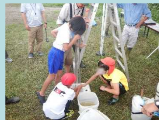
定置網の設置場所を発表しました。明日が楽しみです！！