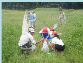
バッタやコオロギをたくさん発見!! 捕まえてみんなで観察だ！