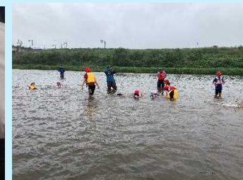
最後に出石川で楽しく川歩き！ ライフジャケットで浮いてみたよ！

児童の感想：加陽湿地に生息するいろいろな種類の昆虫や魚を観察できた。エビや亀を見ることが出来て良かった。川で泳げてとても楽しかった。