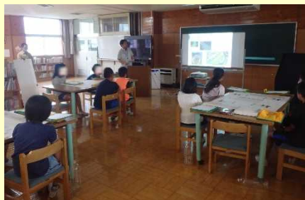
まずは、円山川と加陽湿地について学習。

円山川の概要や加陽湿地・加陽水辺公園について勉強した後、3班に分かれて、どんな魚がいるのか予想して一覧表を作成しました。また、ペットボトル(2リットル)もんどりを作りました。