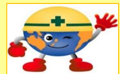
ドボッ君 「土木学会関西支部マスコットキャラク

※36ロール未満で持ち込みを希望される場合は要望欄に記入してください。可能な範囲で調整します。