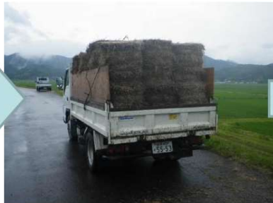
▲ 配布希望者のもとにロール化した刈草を運搬