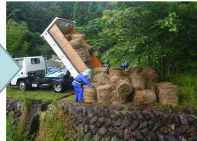
▲ ロール化した刈草を提供