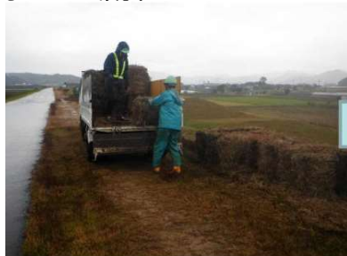
▲ 集草作業後にロール化した刈草を積込