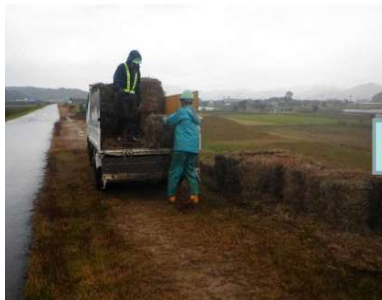
▲ 集草作業後にロール化した刈草を積込