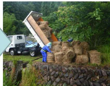
▲ ロール化した刈草を提供