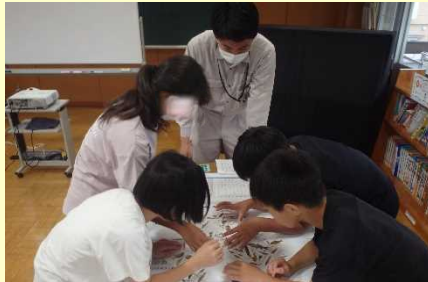
加陽湿地で見つかりそうな魚を予想しました！