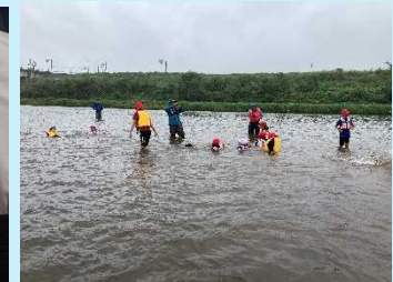
最後に出石川で楽しく川歩き！ライフジャケットで浮いてみたよ！

児童の感想：加陽湿地に生息するいろいろな種類の昆虫や魚を観察できた。エビや亀を見ることが出来て良かった。川で泳げてとても楽しかった。