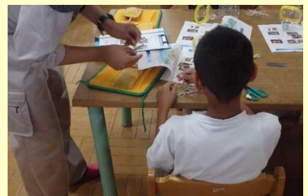
ペットボトルもんどりを頑張って作りました。