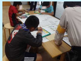
班ごとに魚類調査結果の発表！予想は当たっていたかな～？