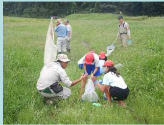
バッタやコオロギをたくさん発見!! 捕まえてみんなで観察だ！