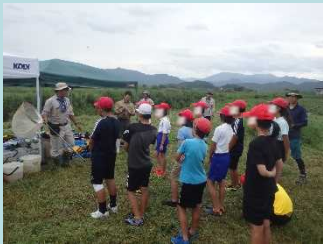
はじめに昆虫採集の方法と注意事項を聞きました！

虫取り網を片手に昆虫採集を行った後、班ごとに分かれ3カ所に定置網ともんどりを設置。昆虫を手で触るのは初めてで怖いけど、たくさん捕まいたいし頑張りました！！