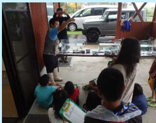
たくさんの魚が取れました。エビや亀もいたよ！！