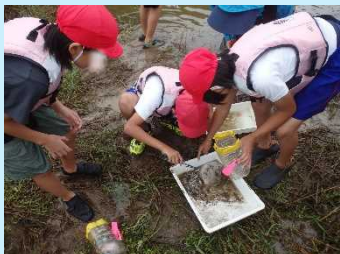
定置網とペットボトルもんどりにはさまざまな生き物が入っていました。

前日に仕掛けた定置網とペットボトルもんどりをあげて、実際に魚・エビを観察しました。採れた魚が予想とあっているか確認し、加陽湿地にどんな魚がいるかを発表しました。