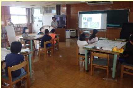
まずは、円山川と加陽湿地について学習。

円山川の概要や加陽湿地・加陽水辺公園について勉強した後、3班に分かれて、どんな魚がいるのか予想して一覧表を作成しました。また、ペットボトル(2リットル)もんどりを作りました。