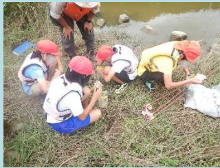
お菓子や食パン、自分で選んだ餌をもんどりに入れて設置したよ！