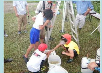
定置網の設置場所を発表しました。明日が楽しみです！！