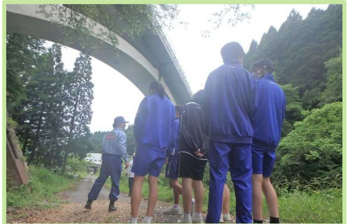
国道9号関宮ループ橋を見学