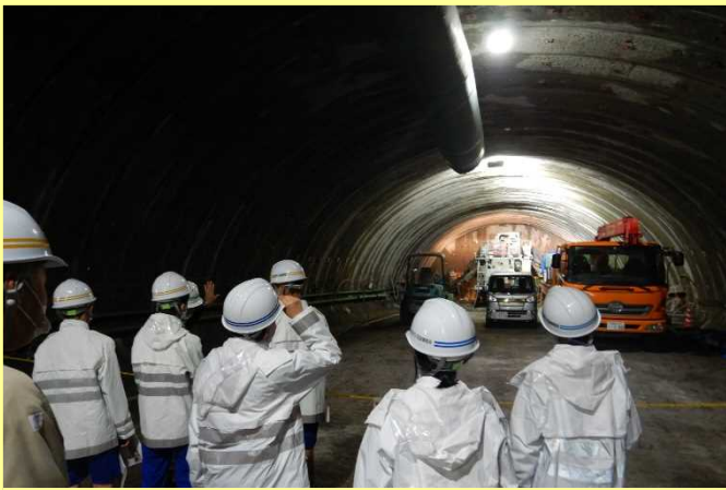
工事中の北近畿豊岡自動車道を見学