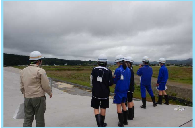
越流堤の上から中郷遊水地を見学