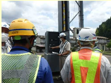
電動操作盤による遮断機の操作