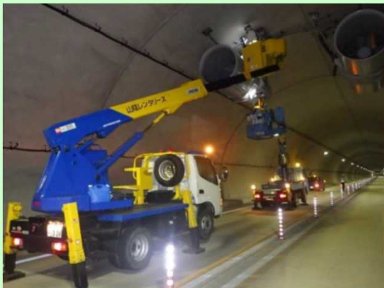
トンネル換気設備点検

安全に走行していただくために 舗装修繕、交通安全施設設置、トンネルや 橋梁の設備点検等を行います。