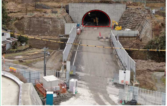
笠波トンネル坑口部の覆工コンクリート工事を行っています。