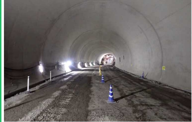
笠波トンネル内の覆工コンクリート工事を行っています。