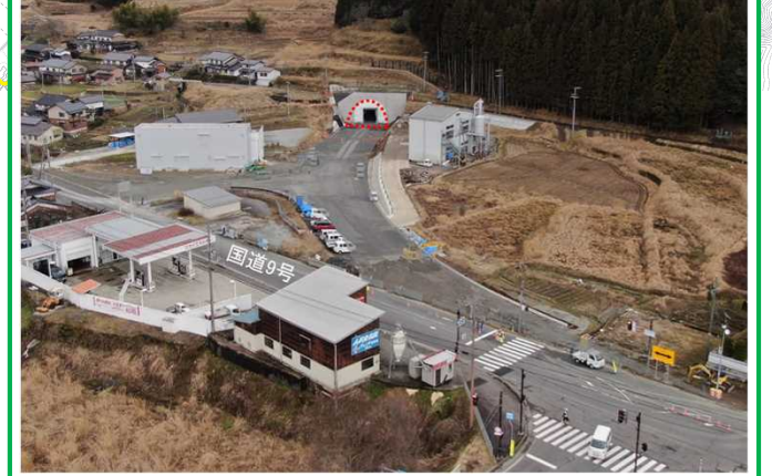
交差点部の改良工事を行っています。